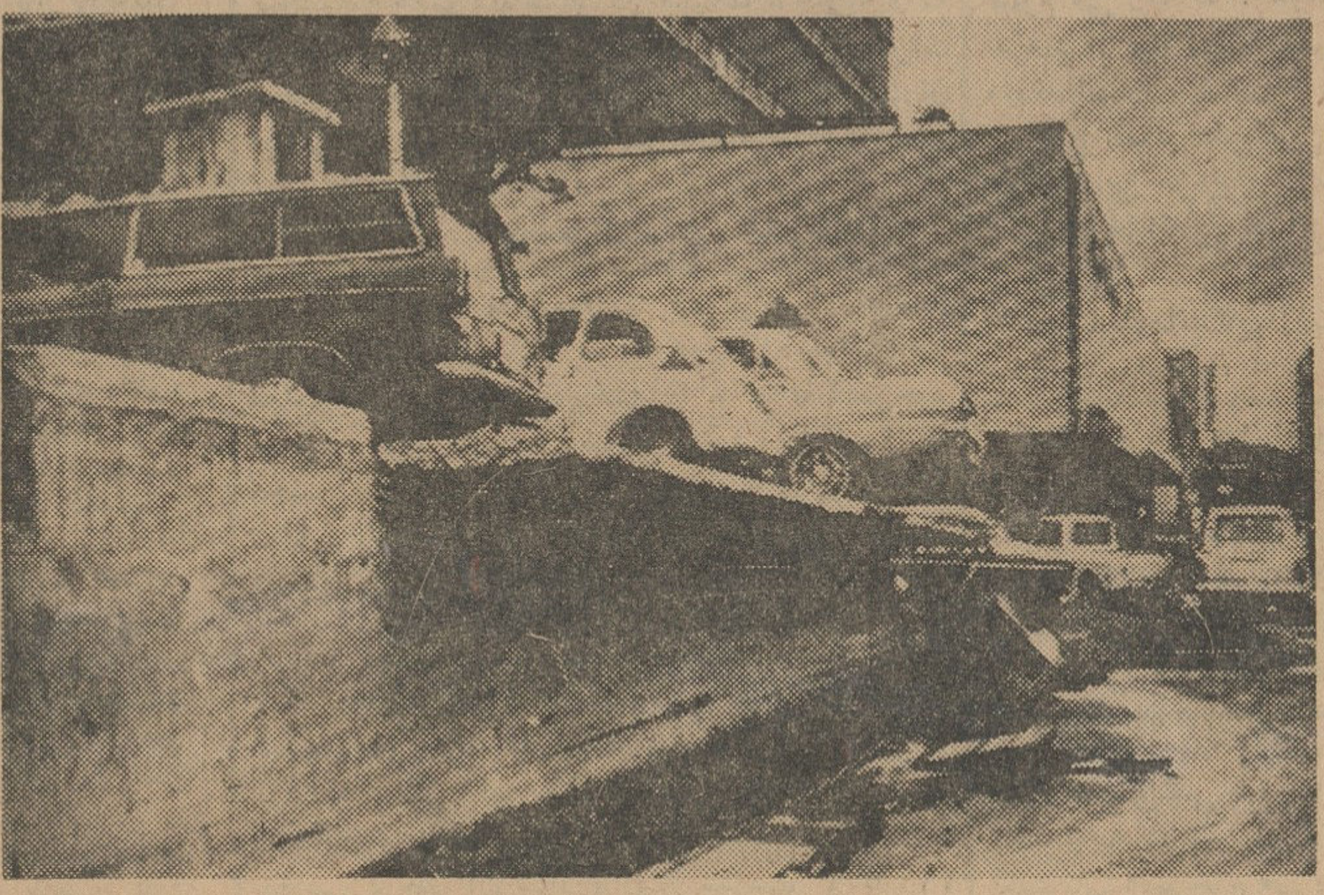
زلزله دیروز زابون خسارات زیادی وارد ساخت در این عکس پارکینگ هتل «نیکانا» که بعثت زلزله شکاف عظیمی در آن بوجود آمده نشان داده شده است .

سیل، زلزله و صاعقه ترکیه، سوریه و یونان را تهدید میکند