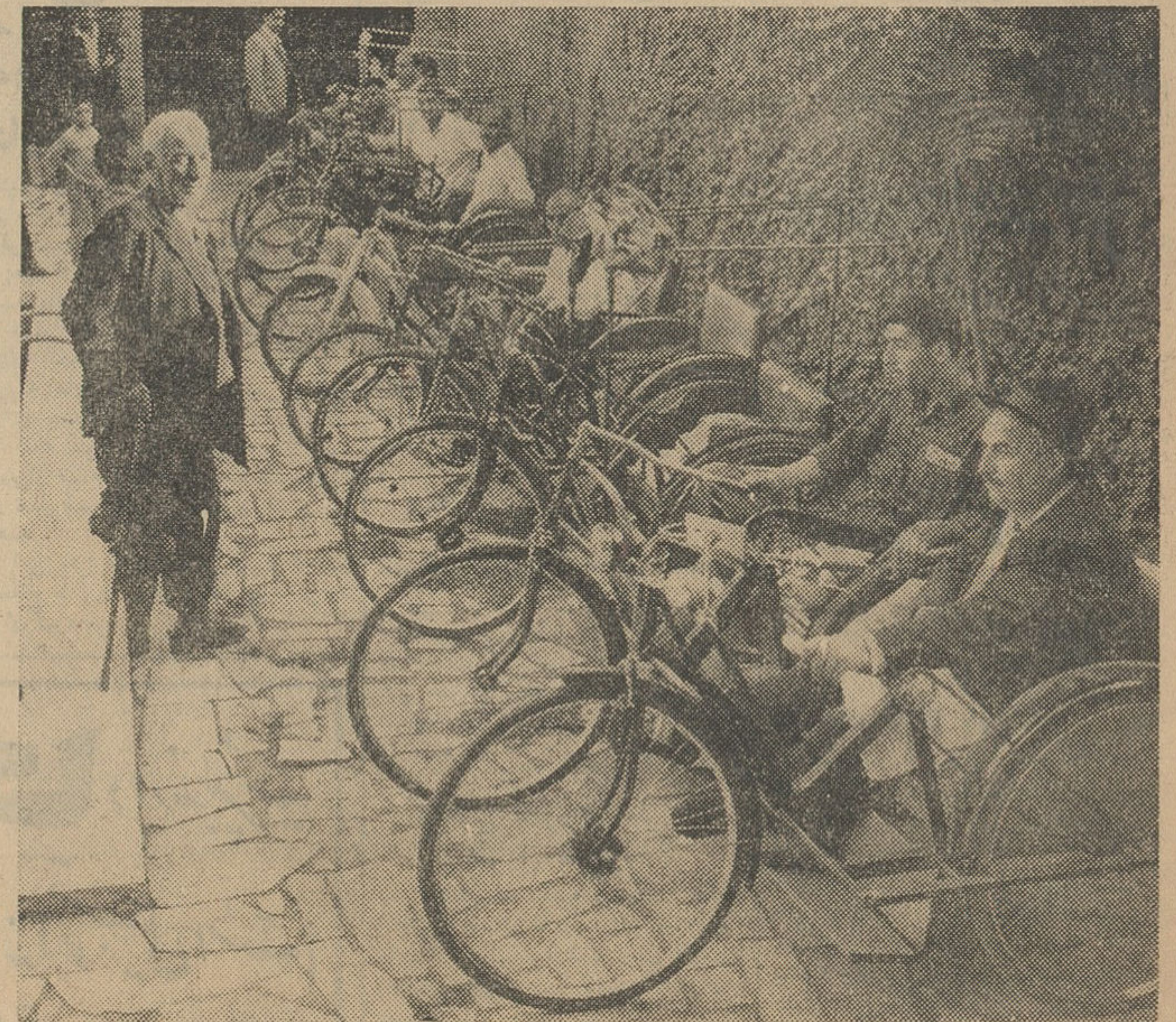
عده‌ای از معلولین تهران که در کانون پرورش معلولین عضویت دارند.

محل مناسب اجتماع آقای دکتر نیکبخت معاون نخست وزیر در این باره اظهار داشت: