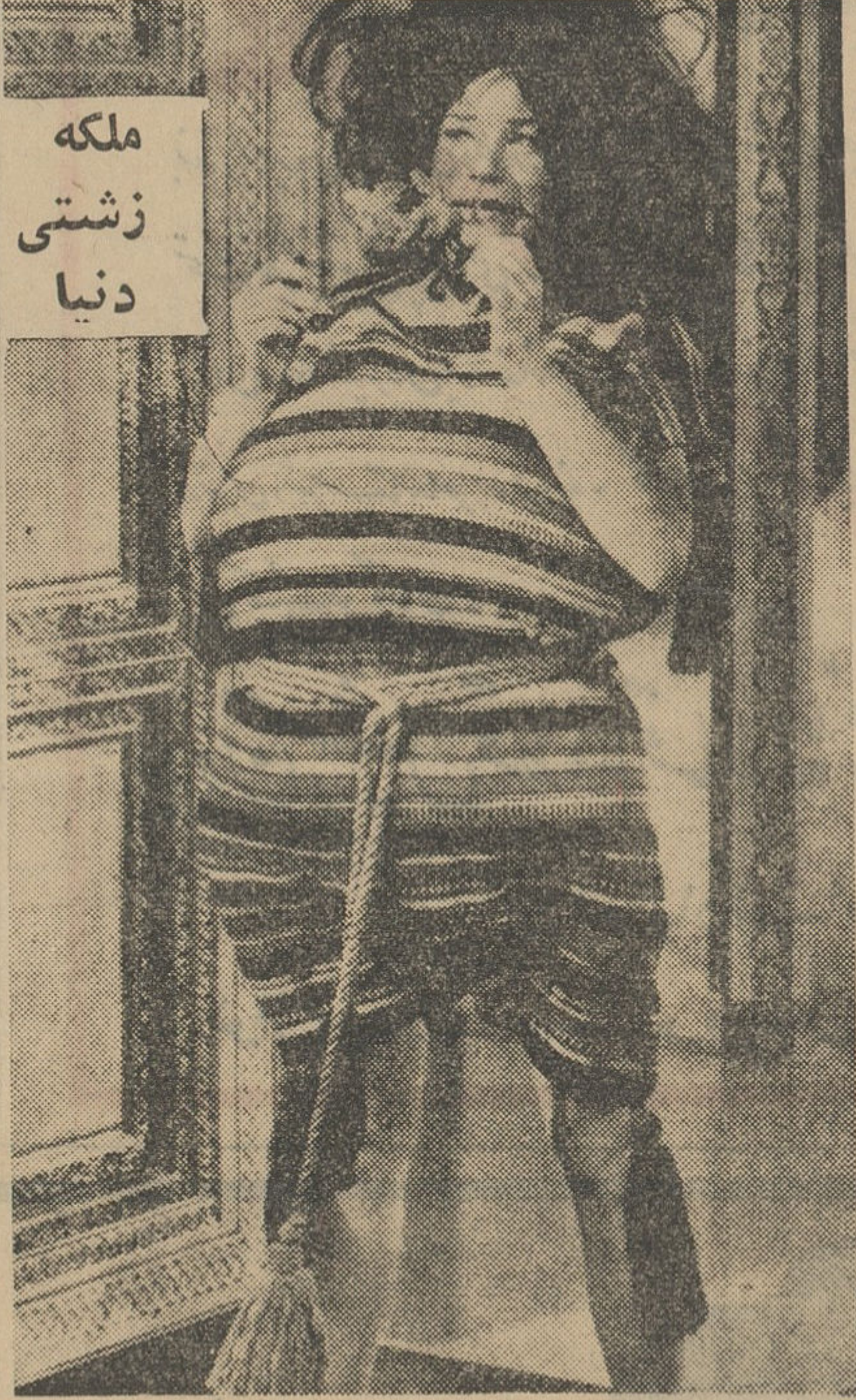
ملکه زشتی دنیا