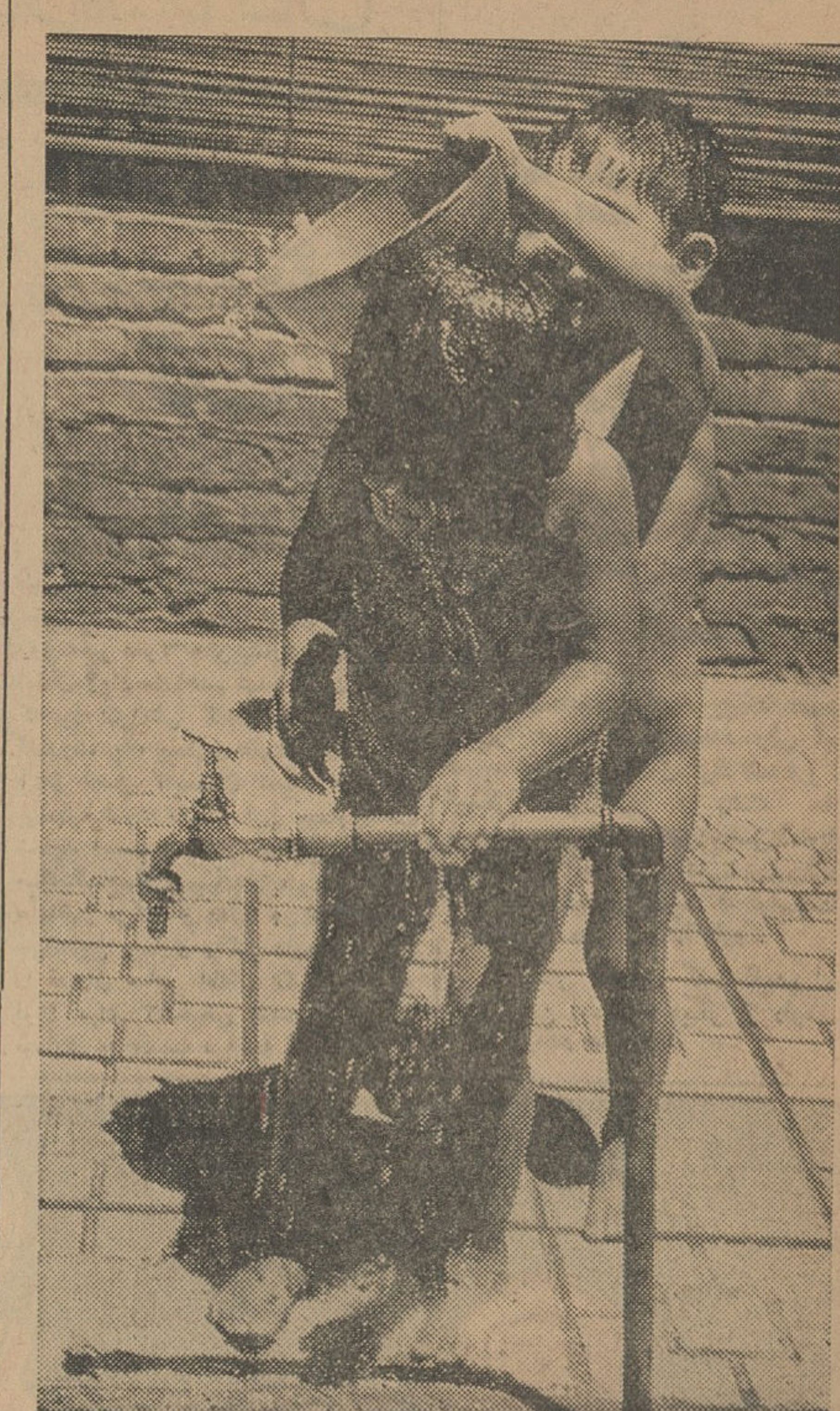
هرگز برای مقابله با گرمای هوا می‌اندیشد، یکی کولر و اینکه بکار می‌اندازد، دیگری از استخر و حوض استفاده میکند و این دو بچه هم بایک سطل آب بجنگ گرماتفته‌اند

بقیه از صفحه اول تهران گرم‌زاده‌ها با تهران زمستان تفاوتی فاحشی دارد و با گرم شدن هوا مسائل اجتماعی و اقتصادی تازه‌ای برای تهران مطرح میشود که بدنبال خود تغییرات زیادی همراه دارد. افزایش سرسام‌آور مصرف آب، گرمی بازار کولر و یخه، از یاد میزان مصرف برق و فروش یخ کسانی بازار گرمایها شیرینی فروشیها، رواج کولرهای تره‌بار و فروش یخ و یخه و اختلافات همسایگی در روی پشت‌بام متجامل مالکین و مستاجرین و زنجورده بر سر آب در محلات بی‌آب تهران و بالاخره افزایش مزاحمت برای خانفامیها که در هوای گرم تهران بالباسای «کولر» و نازک به خنایانهای پندارجمله موضوعات خاصی تهران گرم‌زده‌است که در فصل سرما وجود ندارد.