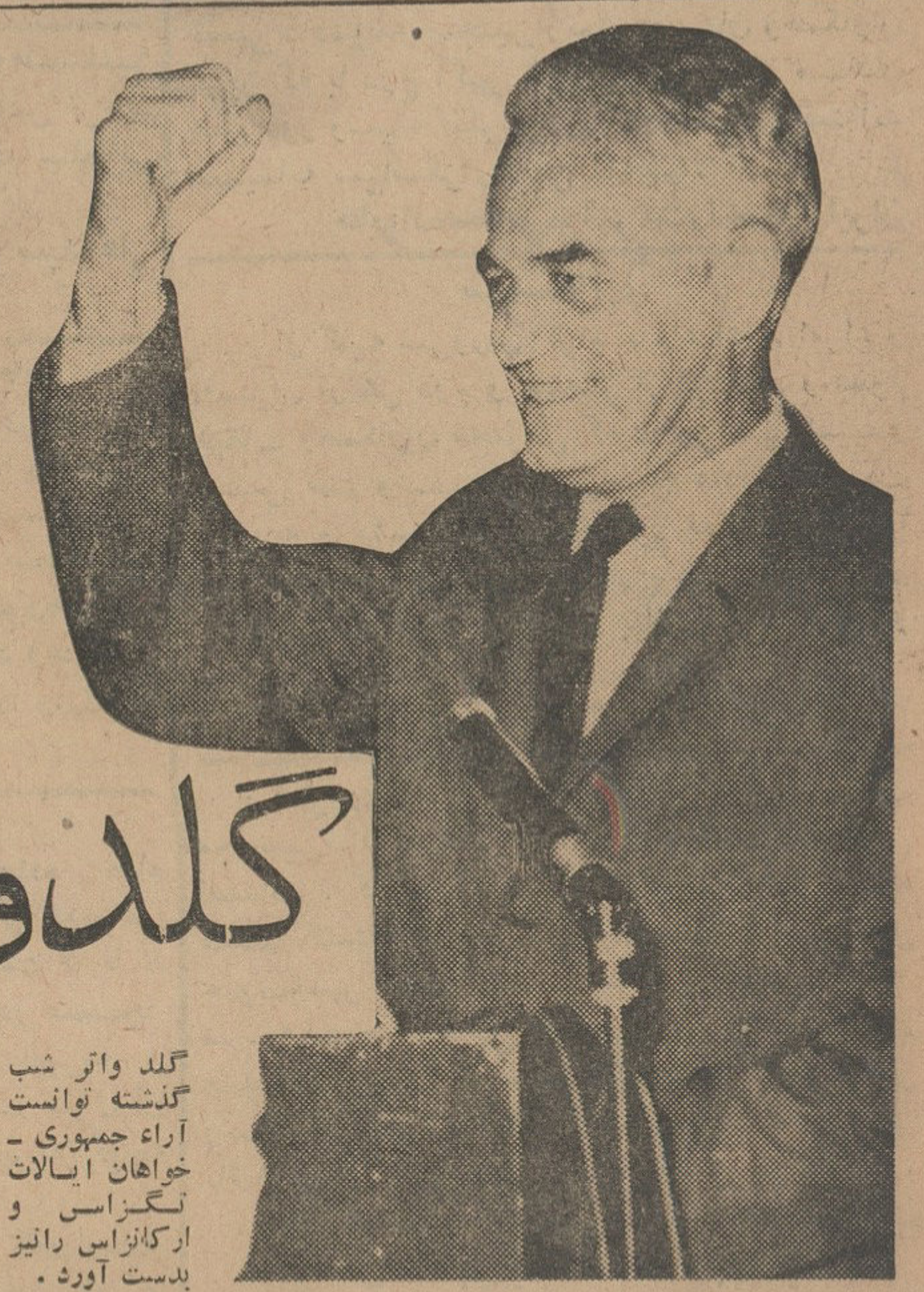
گلدو اتر شب گذشته توانست آراء جمهوری خواهان ایالات تگزاس و آرکانزاس را نیز بدست آورد .

نخست وزیر در کرمانشاه گفت: برای پیشرفت باید وحدت کامل ملی بوجود آید