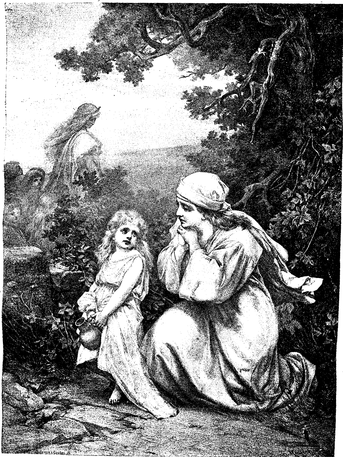
Nu plânge, mamă dulce!