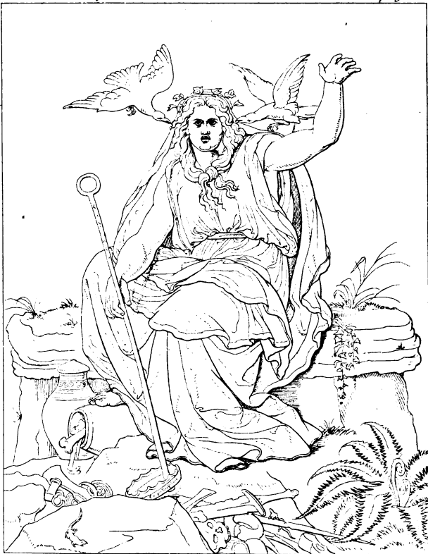
W. v. KAULBACH.