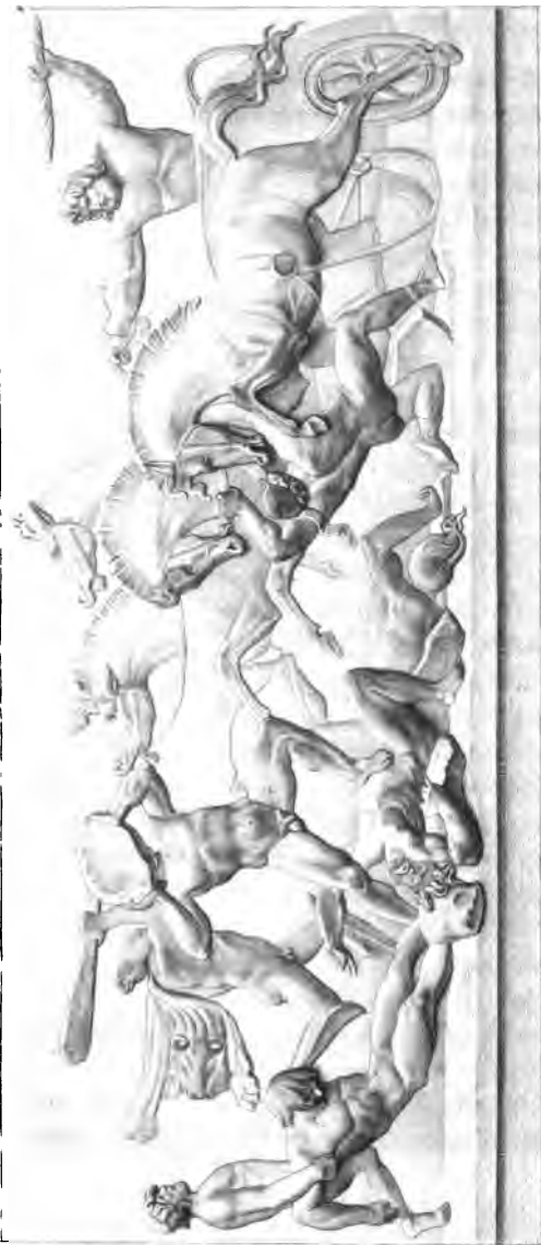
L v. SCHWANTHALER.