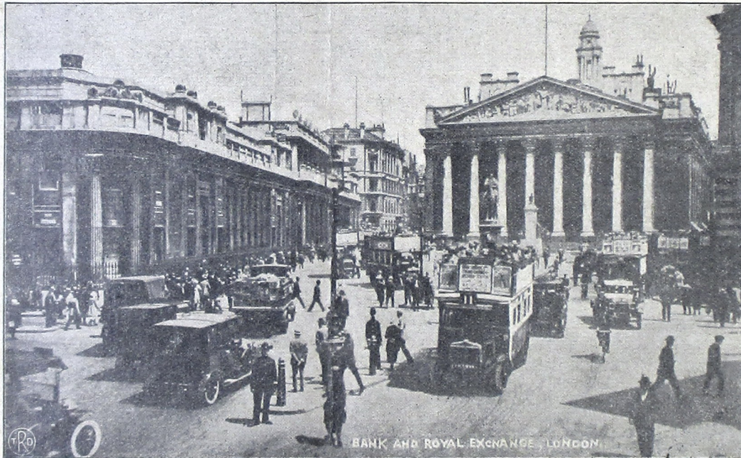
Bank of England, ing London, gedong ingkang sisih kiwa.

keterangan ingkang mratélakaken kedah ambajar dateng tijang ingkang anggadahi serat katerangan waoe. Déné ingkang dipoen wadajibaken anjadé serat-serat kate-rangan (wissel) waoe, inggih poenika: kantor-kantor bank, nanging kosokwangsoelipoen kantor-kantor bank waoe oegi dipoen wadajibaken ambajar wissel ingkang dipoen tampèkaken, kadjawi poenika oegi anjadé wissel-wissel waoe dateng kantor-kantor bank lijanipoen, ma-katen sapitoeroetipoen. Samanten oegi tetijang ing tanah Inggris, manawi badé ngintoenaken arta dateng nagari Walandi inggih sarana toembas wissel kados inginggil,