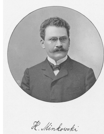
Hermann Minkowski (1864-1909)

Die Minkowski-Räume liefern ein einfaches Modell für die spezielle Relativitätstheorie , 1 man spricht auch von einem Einstein-Minkowski-Raum und die Bilinearform darauf heißt auch Minkowski-Form oder Lorentz-Form . Die klassische Raum-Zeit-Welt ist von der Form \mathbb{R}^3 \times \mathbb{R} , wobei die dreidimensionale Komponente den Raum und die eindimensionale Komponente die Zeit repräsentiert. Darin ist grundsätzlich jede Bewegung von einem Punkt zu einem anderen möglich, solange der zweite Punkt zeitlich später als der erste Punkt ist. Entsprechend repräsentieren die Punkte in einem vierdimensionalen Minkowski-Raum die relativistischen Weltpunkte (die Ereignisse); eine Trennung in Raum und Zeit ist Beobachter-abhängig; die Theorie liefert auch eine Definition, was ein Beobachter ist, siehe unten. Eine besondere Rolle spielt die Menge der Vektoren