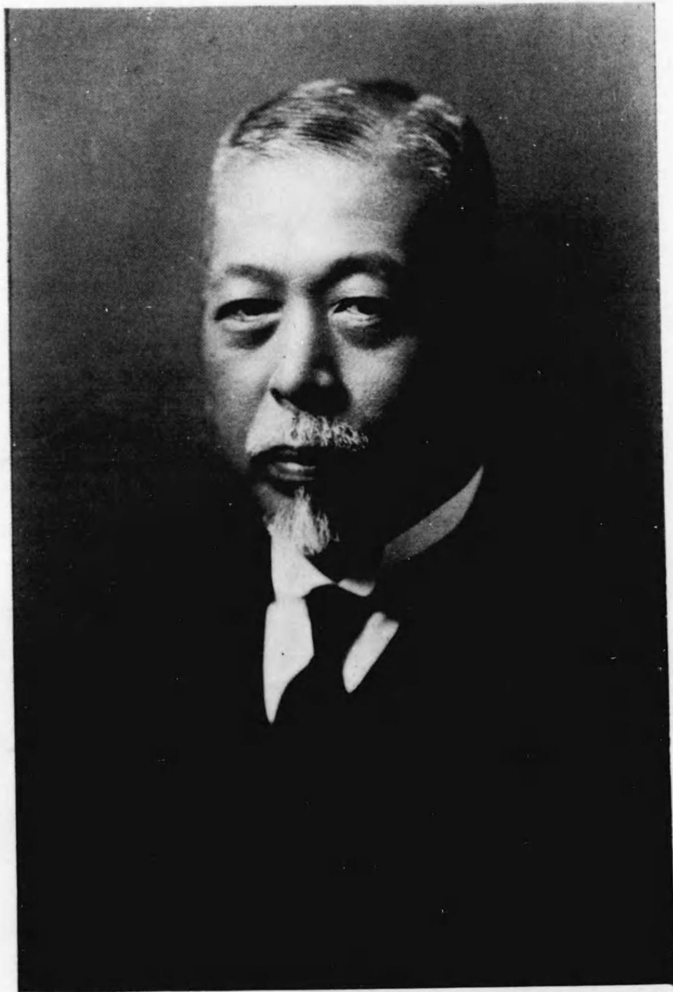
著者の近影と自署