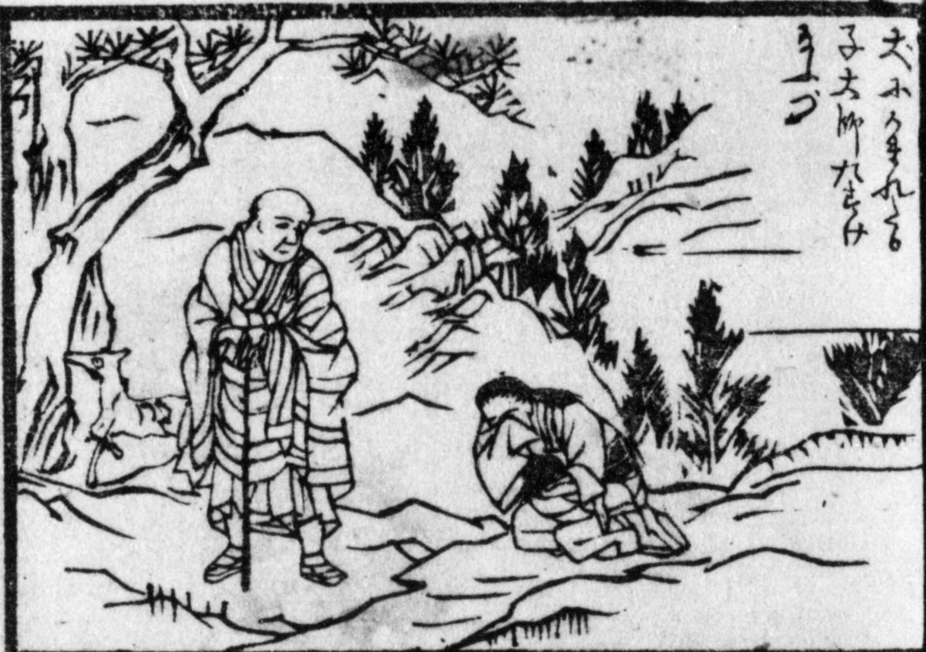
大なるまはれ 子大柳たまひ まよつ

其の父もがらむにわらわりのあゝあゝとあつた 多とてしあゝあゝとけがたあゝとてあゝと めー死せる里のこらと後生の児痛くあつた へあたちやちよよみぐりゝゝ口も疼たるの老女 乾ふ大海を地へまひよりとびあつた せせりうえ海結戒の法を修したまひなせ 後りゝゝとあゝとあゝとあゝとあゝと たり