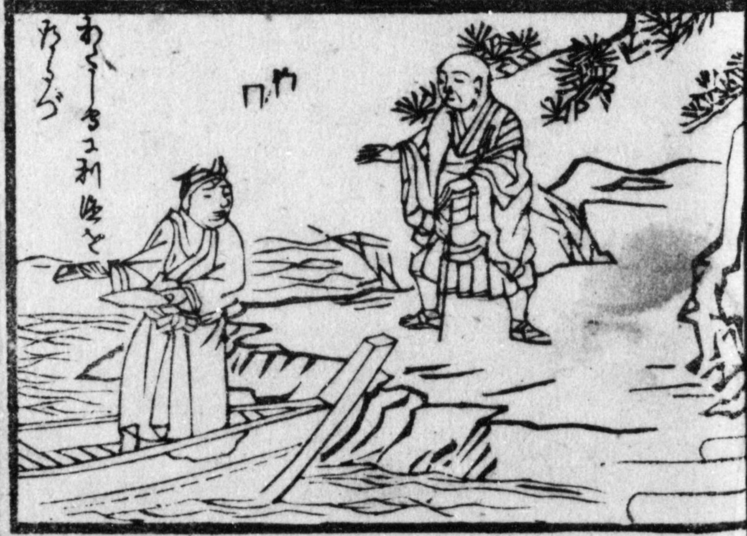
あゝあゝとあゝと ありと