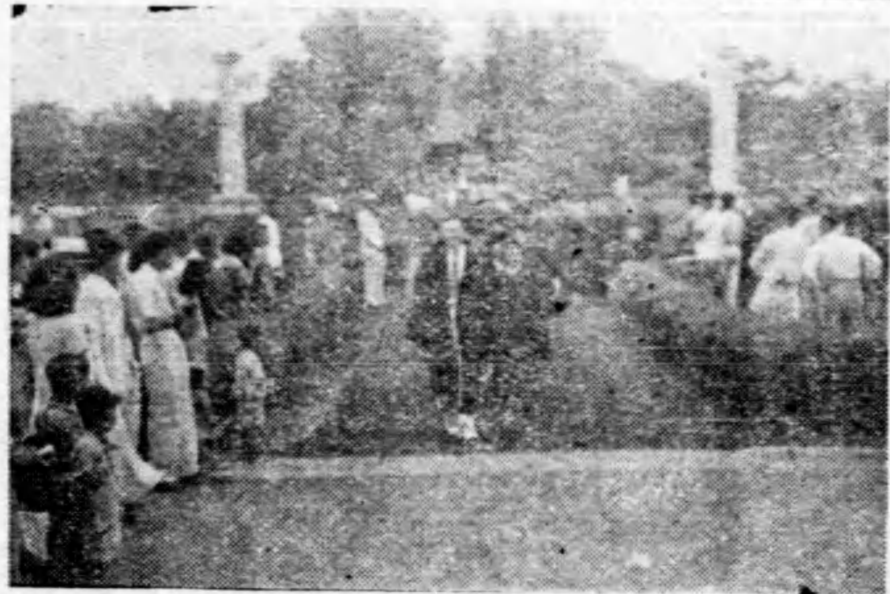
石文博士引導畢業生入禮堂

戰火燒遍了半個中國，燕京又把一批青年男女送到災禍與飢饉交織的社會裡。貝公樓外依然如往昔的畢業日一樣，停放着許多漂亮的汽車，禮堂的樓上和樓下擠滿了情緒興奮的聽眾，尤其今年因爲返校節未能舉行，所以從各地來參加畢業典禮的校友遠較往年爲多。然而這些人的感覺和往年是不會一樣的。司徒先生對畢業生說：「燕京在物質方面的困難雖然很多，很需要校友們的幫助，但我絕不希望你們畢業後的目的只是爲賺錢。燕京在經濟的困難中更可激起奮鬥的精神。」 上午十點鐘的時候，賓在後，分從穆樓及生物樓出來，走向貝公樓禮堂，各地攝影記者，分別攝取鏡頭，其中以孔祥熙先生，司徒先生，陸志韋先生及寶維廉先生被攝影次數最多。