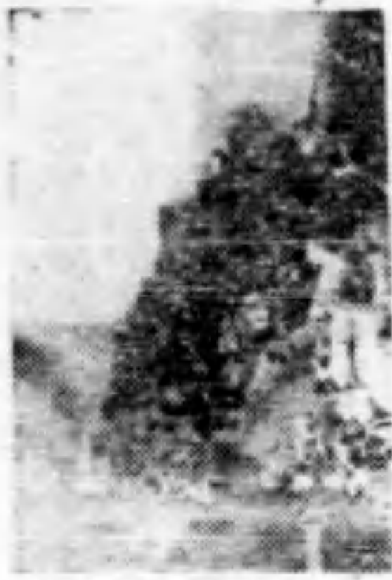
一部畢業同學在行進中