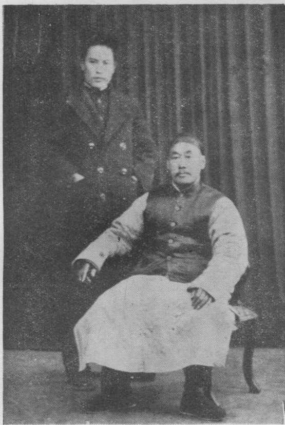
三十年代初作者与父亲摄于杭州