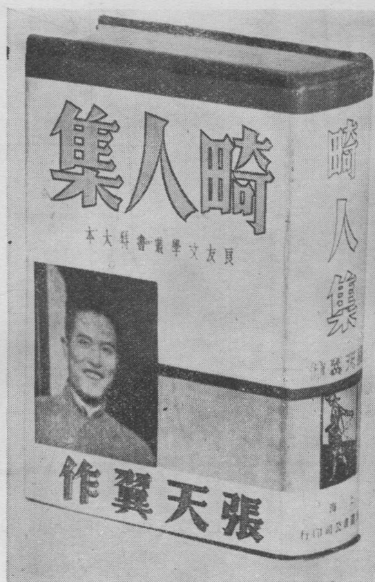
《畸人集》(1936年1月)初版本封面