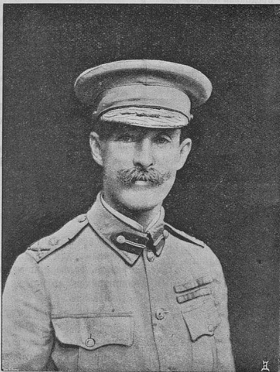
Генераль-лейтенантъ Сэръ Янъ Гамильтонъ, начальникъ штаба въ Южной Африкѣ.

Лордъ Метуэнь, повидимому, закончившій (по крайней мѣрѣ, въ Африкѣ) свою военную карьеру, принадлежитъ къ числу самыхъ блестящихъ представителей британской аристократіи. Богачъ, красавецъ, гигантъ и атлетъ, онъ былъ очень любимъ своими солдатами, прощавшими ему даже его пораженія. Лично Метуэнь чрезвычайно храбръ и подъ самымъ