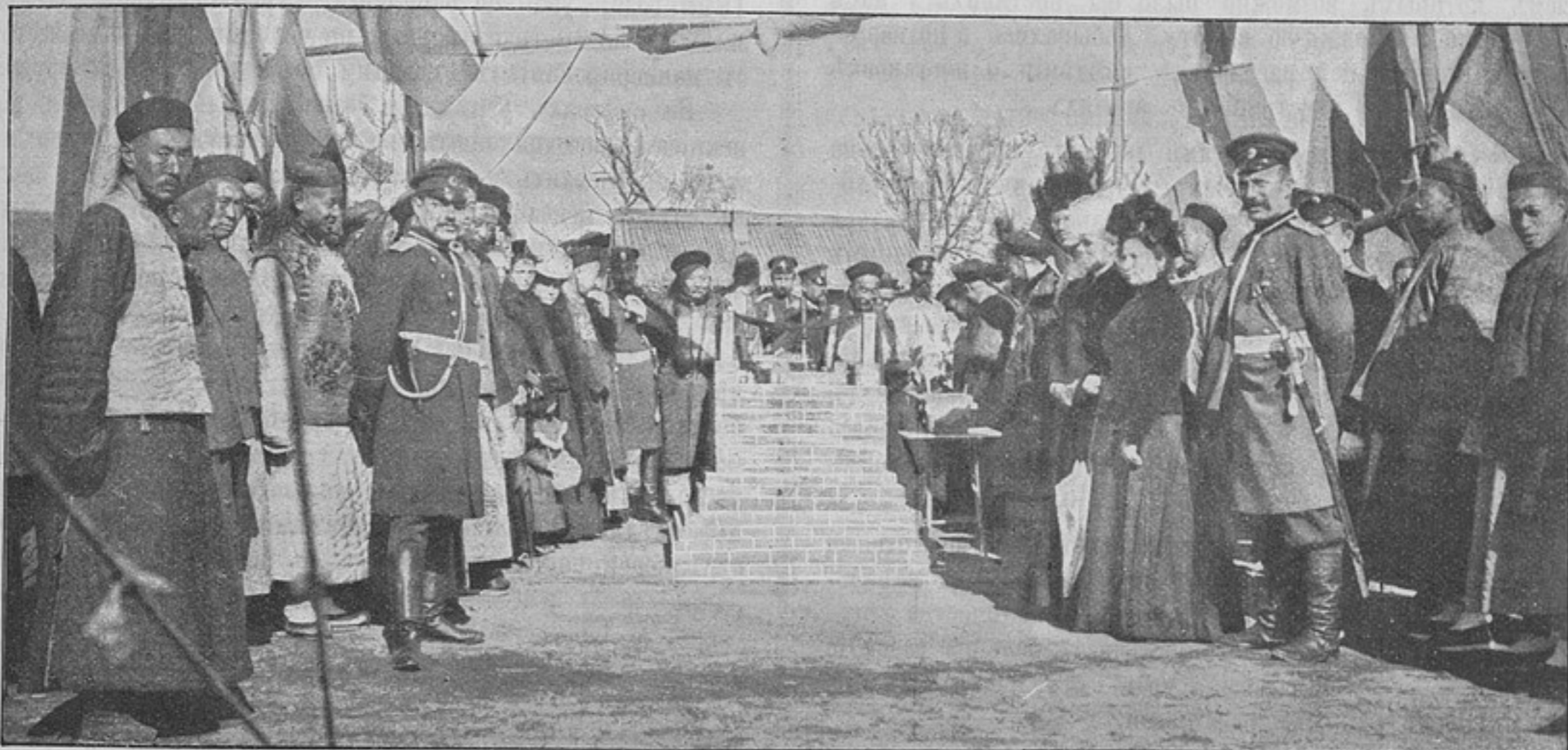
Открытіе китайцами памятника въ честь русскихъ войскъ въ г. Кайюньсянѣ (къ корреспонденціи «Кайюньсянъ»).

Не останавливаясь на перечисленіи задачъ, положенныхъ въ основу дѣятельности инспекціи при ея учрежденіи, я попробую лишь прослѣдить вкратцѣ, что было сдѣлано инспек-