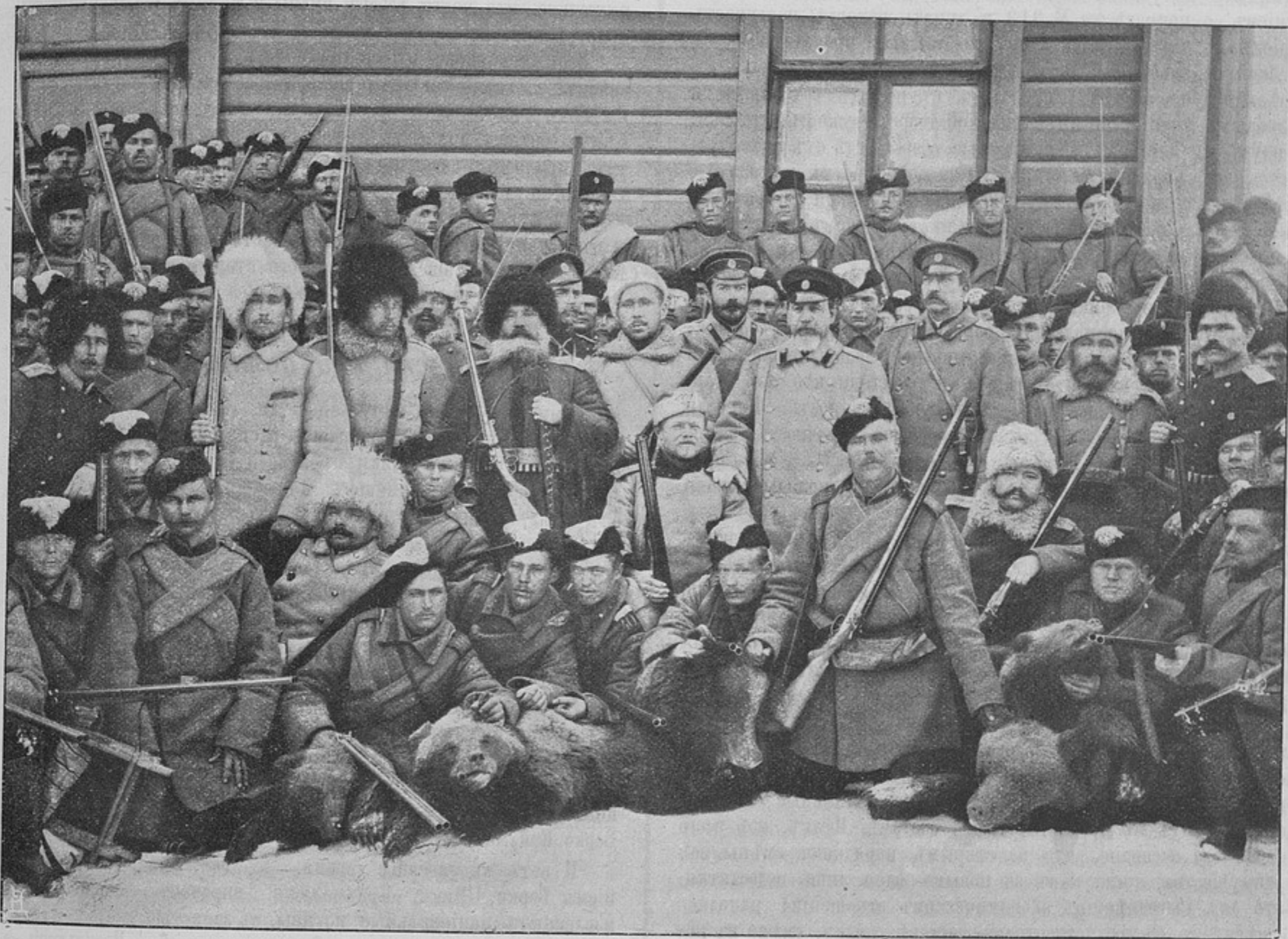
Группа участниковъ зимней экскурсіи охотничьихъ командъ 40-й пѣхотной дивизіи (къ корреспонденціи «Бобруйскъ»).

«Онъ сторонникъ рѣшительныхъ мѣръ и если не часто рѣшается на приступъ, то потому, что хорошо знаетъ характеръ и настроеніе своихъ буровъ или же предвидитъ сдачу непріятеля безъ тяжелыхъ потерь, связанныхъ съ занятіемъ позиціи съ бою. Его приказанія коротки и подчасъ кажутся невыполнимыми; но онъ всегда знаетъ, кому что приказать... Онъ вспыльчивъ и дѣйствуетъ подчасъ необдуманно. Горе бѣглецу, попавшемуся ему на дорогѣ: онъ немилосердно отхлещетъ его своимъ поясомъ съ патронами. Кронье выслушалъ отъ него не одну непріятную истину и никто не разочаровался въ его военныхъ способностяхъ... Какъ на совѣтахъ, такъ и въ полѣ онъ выказываетъ необыкновенное спокойствіе, рѣшительность и смѣлость... Въ заключеніе этой краснорѣчивой характеристики прибавимъ, что еще въ началѣ войны, въ сраженіи при Твеериверѣ, Деларей потерялъ сына... —й.