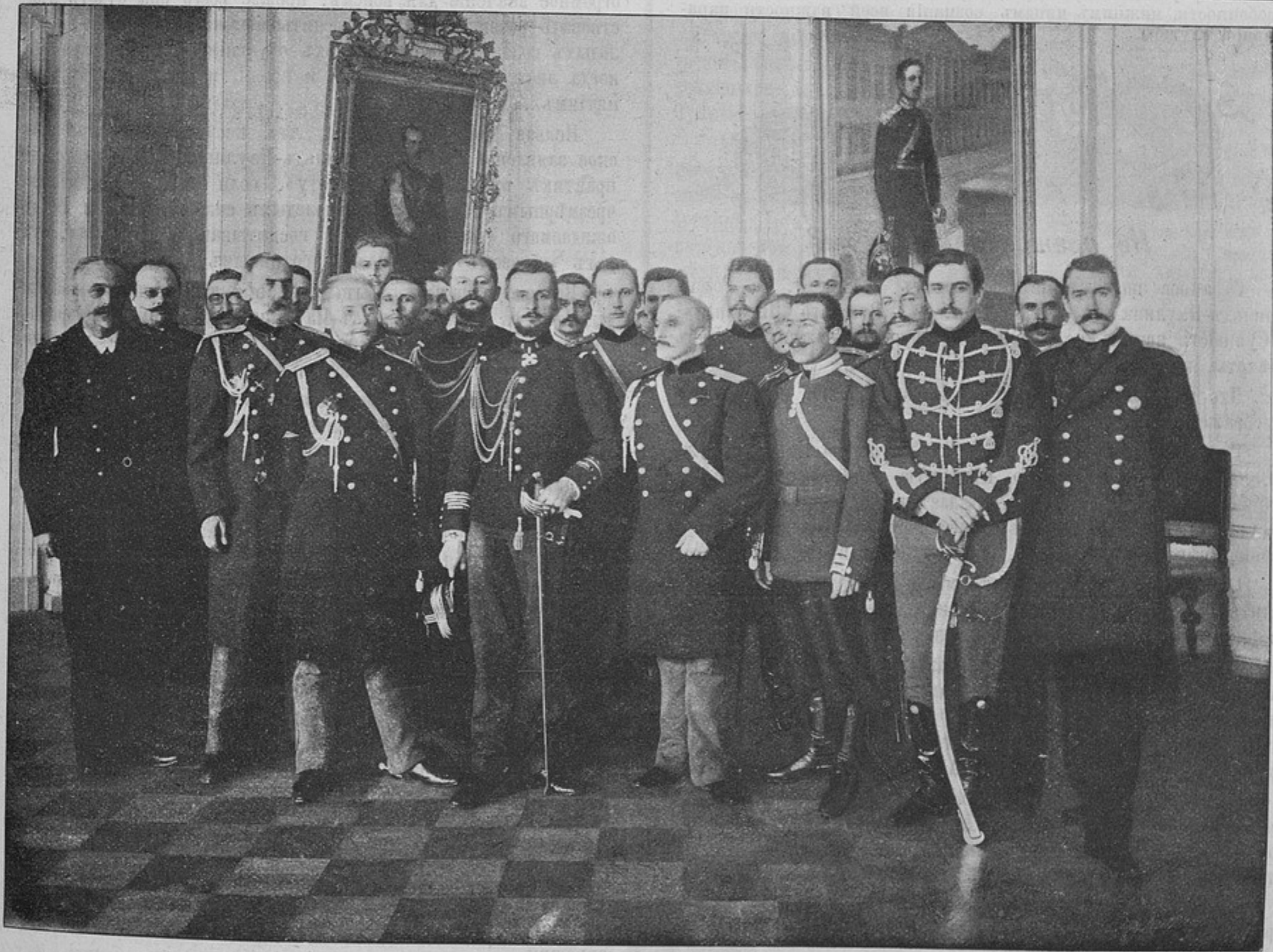
Полковникъ Маршанъ въ Николаевской академіи генеральнаго штаба.