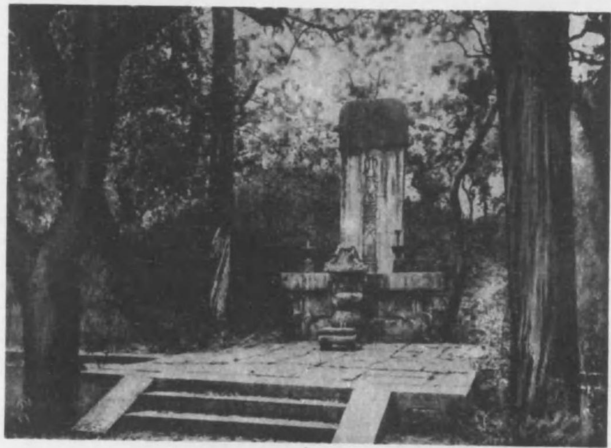
山東省曲阜縣至聖林內孔子墓

孔子名丘，字仲尼。魯人。父曰叔梁紇。母顏氏。魯定公爲中都宰，進爲司空，又爲司寇。其後不用，遂周流四方。歸魯，定詩書，正禮樂，贊周易，修春秋，以傳先王之道。弟子三千人，身通六藝者七十二人。生於周靈王二十一年冬十月庚子，卒於敬王四十一年夏四月乙丑，年七十三。唐開元二十七年，追諡文宣王，後加號大成至聖文宣王。清順