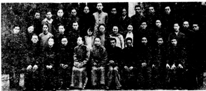
〔文學會全體攝影照片〕