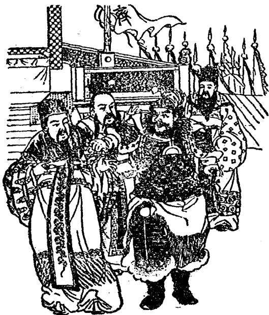
將軍罷了，寡人已經答應了。