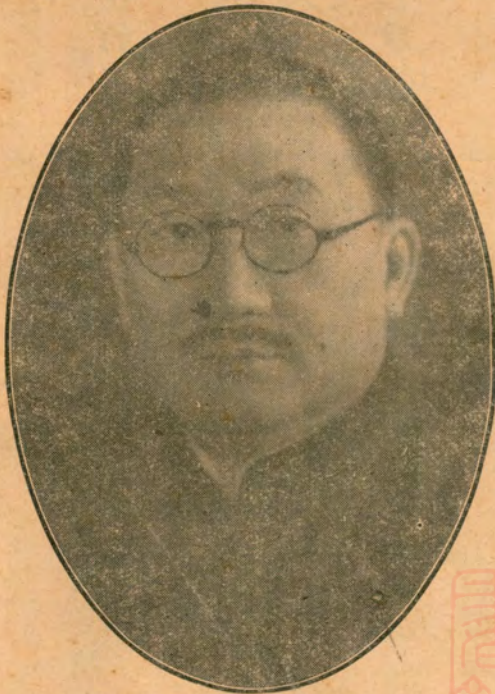
財政部孔部長最近玉照