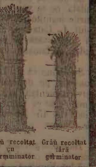
Grâu recoltat cu germinator

CEREȚI BROȘURA EXPLICATIVĂ LA AGENȚIA HAVAS, BUCUREȘTI.