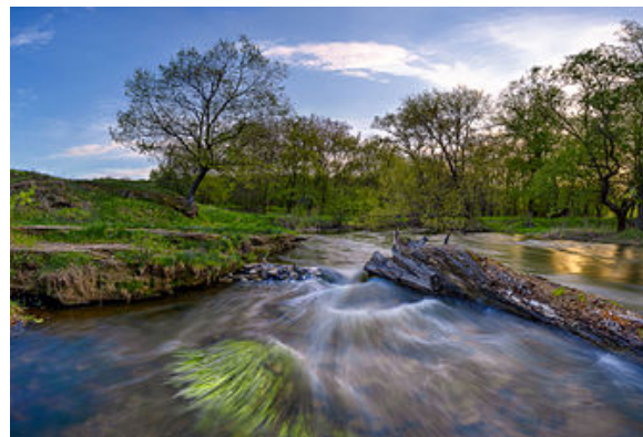
Balkhovit, Zuivskiy Park, Donetsk