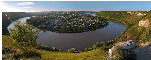
Сергій Криниця (Haidamac), Dniester Canyon

Auf die Einsender der besten Fotos warten attraktive Preise.