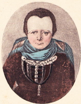
Frau A. J., geb. 1740 auf Hamburger Hallig.