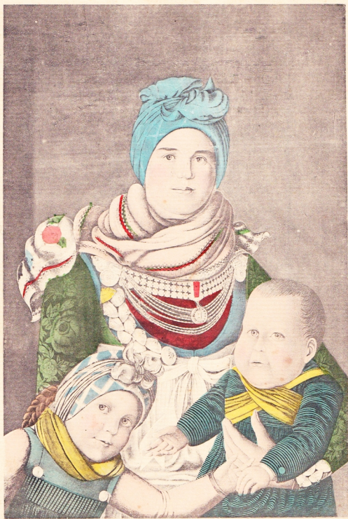
Frau und Kinder v. Westerland-Föhr. ca. 1820.