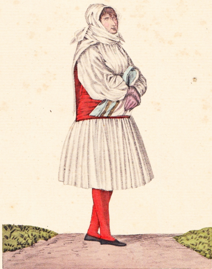
Almindelig Fruentimmerdragt paa Oen Sylt. Gewöhnliche Weibertracht auf der Insel Sylt.