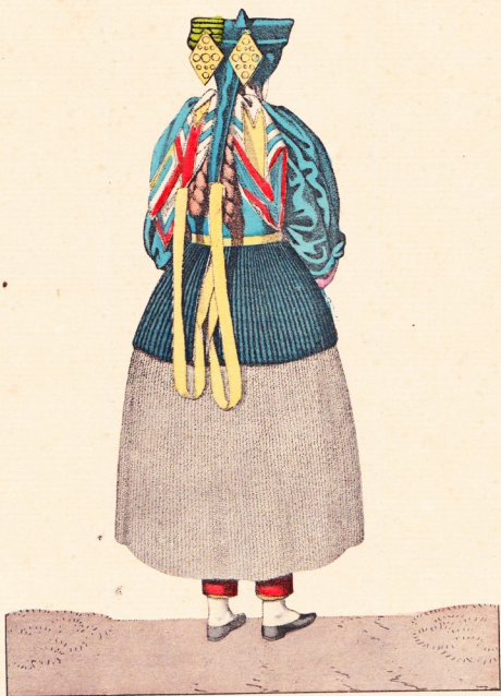
En Kones Dragt til Alters at see bagfra, paa Oen Föhr. Einer Frauen Anzug zur Communion, von hinten zu sehen, auf der Insel Föhr.