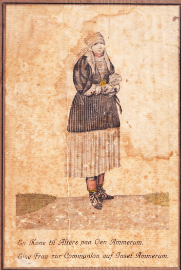
En Kone til Alters paa Oen Ammerum.