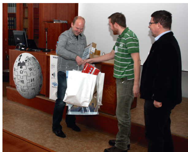
Z předávání odměn pro 2. běh Cen za rozvoj české Wikipedie.

Třetí běh Cen za rozvoj české Wikipedie byl vyhlášen na druhé Wikikonferenci 4. prosince a lhůta pro zlepšování článků běží od 12. prosince do 31. března 2011. Novinkou zařazenou do pravidel Cen je podpora začínajících autorů.