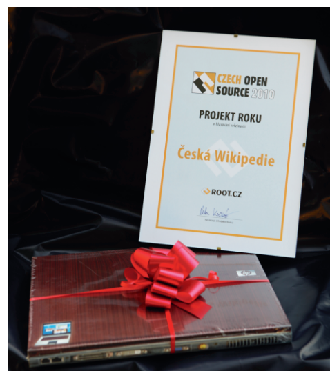
Ocenění z ankety Czech Open Source 2010 pro českou Wikipedii. Foto Petr Novák. CC-BY-SA.

Na počátku roku se sdružení připojilo ke třem petičním aktivitám: Pod petici proti softwarovým patentům, pod Manifest public domain a pod petici za odtajnění průběhu jednání o dohodě ACTA. Souhlas s tímto postojem vyjádřila většina členů sdružení v korespondenčních hlasováních.