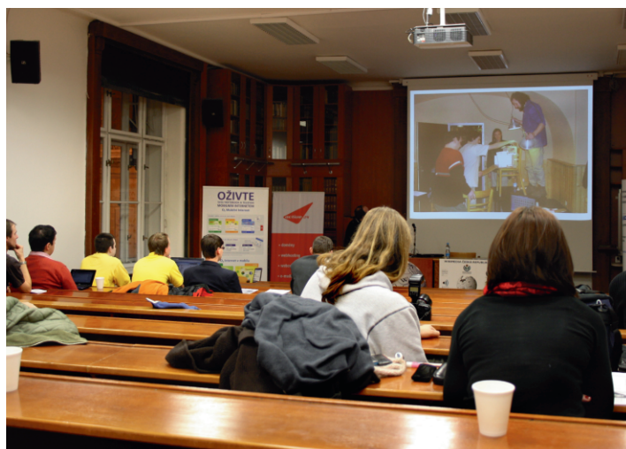
Pohled do sálu při odpolední prezentaci fotoworkshopu Wikimedia ČR.

Na rozdíl od prvního ročníku, který uspořádalo sdružení Wikimedia Česká republika samostatně, tentokrát byla konference společným dílem sdružení, projektu Wikinomie.cz a projektu WikiSkripta. Program konference byl