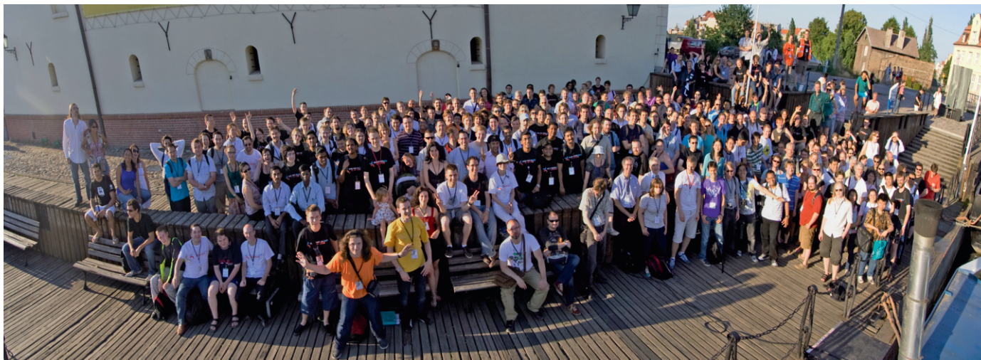
Skupinová fotografie účastníků Wikimanie 2010.

Na konci roku se sdružení aktivně zapojilo do podpory sbírkové kampaně Wikimedia Foundation.