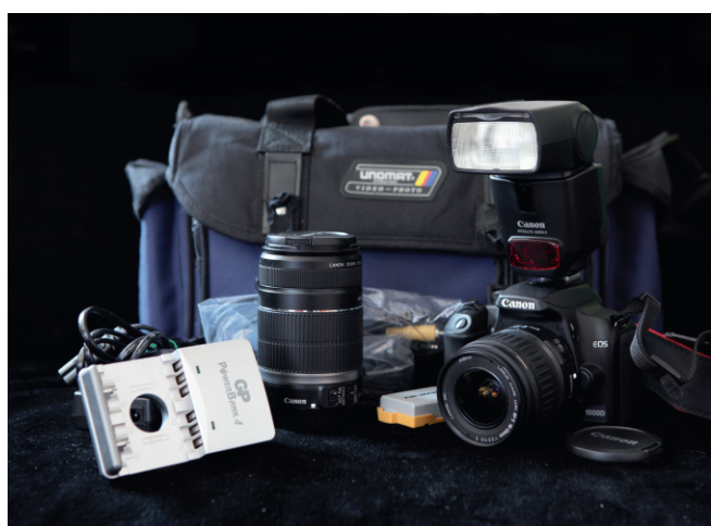
Fotografické vybavení Wikimedia ČR pořízené z grantových prostředků WMF sloužilo i pro potřeby jiných grantových projektů. Foto Petr Novák. CC-BY-SA

Nadace Wikimedia Foundation tyto projekty financovala částkou, která (po odečtení poplatků za převod z USA) činila 149 383,36 Kč. Většinou se ukázalo, že požadavky sdružení byly nadhodnocené a že náklady je možné ještě více minimalizovat. Hospodárné využívání prostředků ale na druhou přispělo k rozhodnutí nadace dále podporovat sdružení, umožnit čerpání nespotřebovaných prostředků k dalším účelům a především vedlo k úsilí vypracovat nový, pružnější systém financování grantových programů.