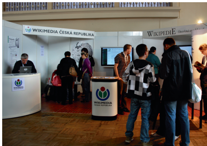
Pohled na stánek Wikimedia Česká republika zaplněný návštěvníky veletrhu Svět knihy 2010.

Základem stánků je od loňského roku pop-up stěna věnovaná společností BONO Art, na pražských akcích byl tahákem opět prezentační stůl Microsoft Surface. Repertoár letáků rozdáváných zájemcům byl doplněn o výtisky časopisu Wikimedium.