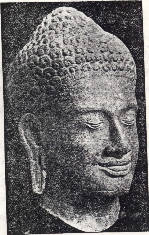
អង្គរធំ — នេះគឺព្រះកេសព្រះពុទ្ធរូបសម័យអង្គរ ។

ព្រះបាទជ័យវរ្ម័នទី៧ បានប្រារព្ធធ្វើបន្ទីក្ស ចំនួន ១៥ ក្នុងរាជធានីយ័ន ។ ព្រះបាទជ័យវរ្ម័នទី៧ បានប្រារព្ធធ្វើបន្ទីក្ស ចំនួន ១៥ ក្នុងរាជធានីយ័ន ។ ព្រះបាទជ័យវរ្ម័នទី៧ បានប្រារព្ធធ្វើបន្ទីក្ស ចំនួន ១៥ ក្នុងរាជធានីយ័ន ។