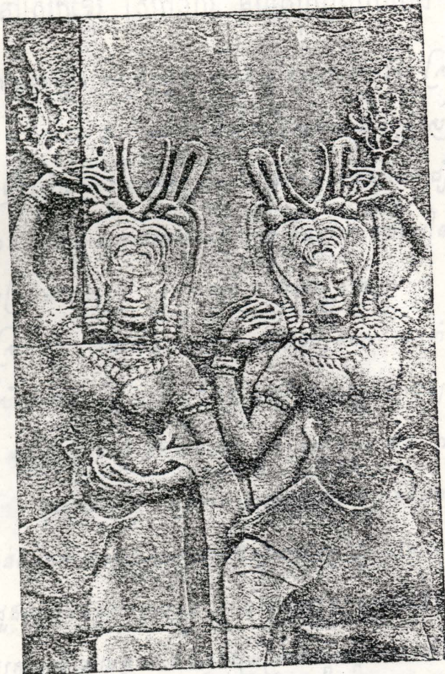
អង្គរវត្ត — នេះរូបស្ត្រីទេពអប្សរ នៅបណ្ណាល័យ (ហោត្រី)