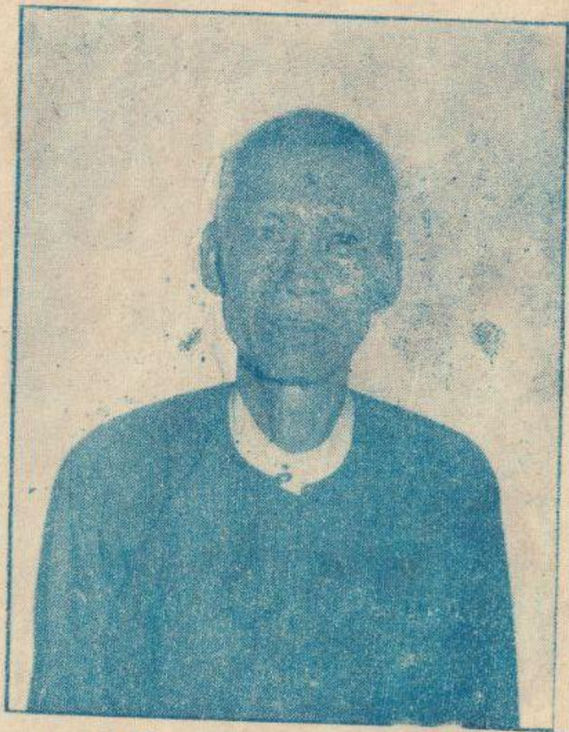
ဦးရှင် - အာစာဗညာသင်္ဂဟ ကွန်ကန်စိန်။