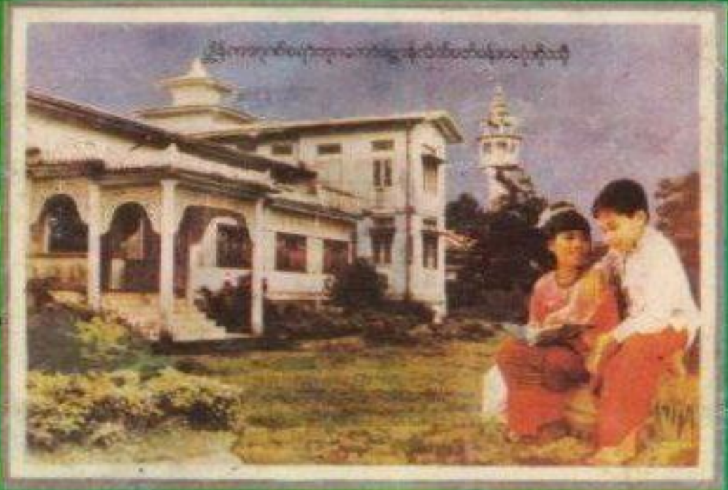
အာစာဗညာသင်မန်(ကအ်စိန်) ဝါဒီပတ်မန်သင်ပုဂ္ဂိုလ်

ဂကောံသင်ကွတ်အ္ဗာန်လိက်ပတ်မန် ကွန်ကအ်စိန်