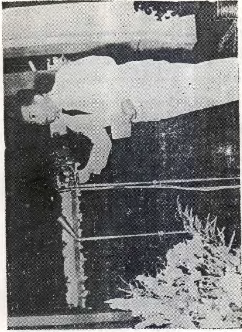
សម្តេចព្រះប្រមុខរដ្ឋ ទ្រង់ថ្លែងព្រះសុទ្ធកថា ទៅទោសពិធីអនុសំបូរ មន្ត្រីសង្ឃលើកទី ២០ ទៅយុទ្ធកិរិយាលយ ព្រះសុភម្រឹត ថ្ងៃទី ១០-១-៦៤