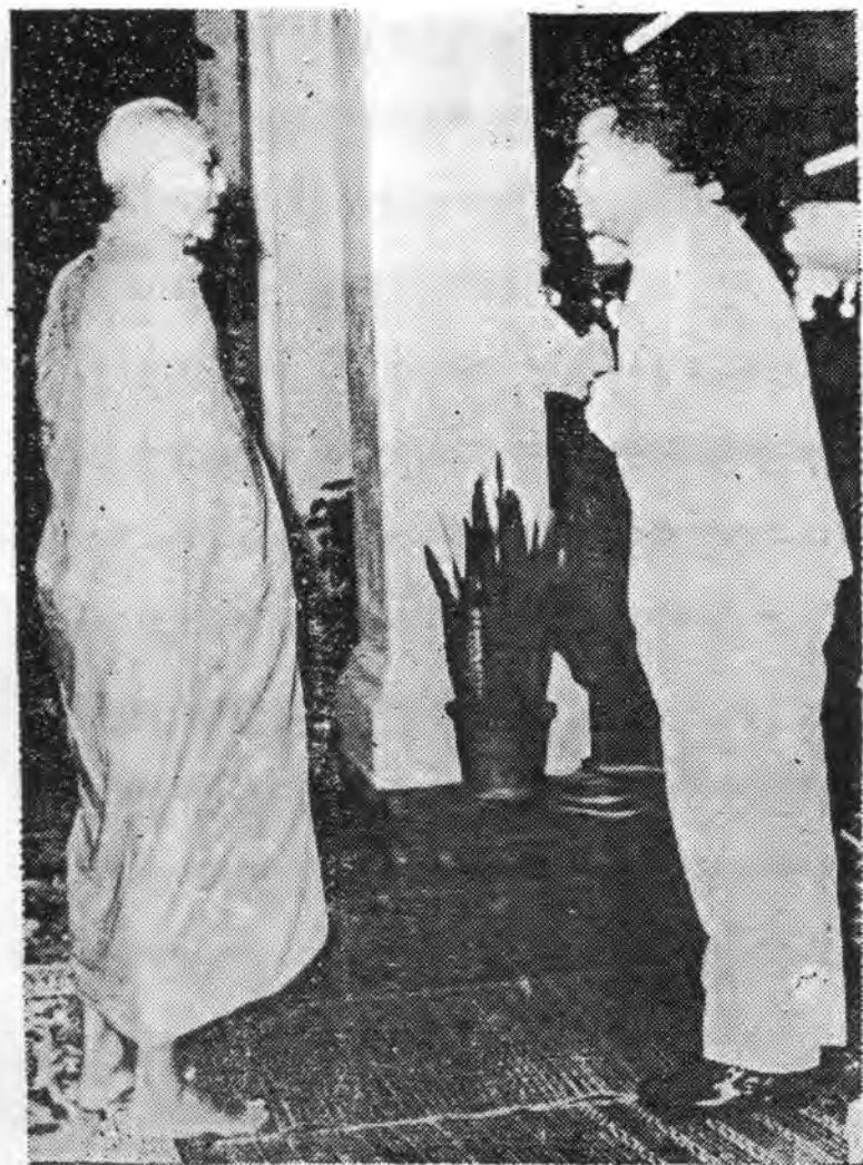
សម្តេចព្រះប្រមុខរដ្ឋ និងសម្តេចព្រះមហាសង្ឃរាជទី ១ ទ្រង់កំពុងសន្ទនា នៅទណស ភិគីអនុសំវ័ច្ឆរមន្ត្រីសង្ឃ លើកទី ២០ នៅយំពុទ្ធករិទ្ធាស័យ ព្រះសុរាម្រឹត ថ្ងៃទី