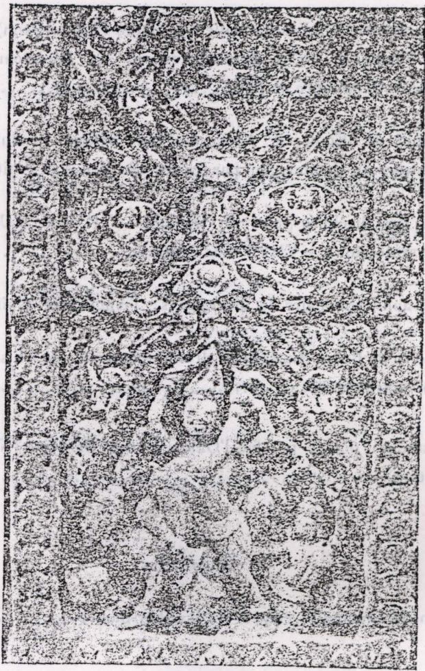
រូបចម្លាក់ដែលលយចេញពីប្រាសាទកណ្តាលនៃប្រាសាទ បន្ទាយសំរែ ។ ការរចនាសម័យប្រាសាទនគរវត្ត សតវត្សរ៍ ទី ៩ នៃពុទ្ធសករាជ