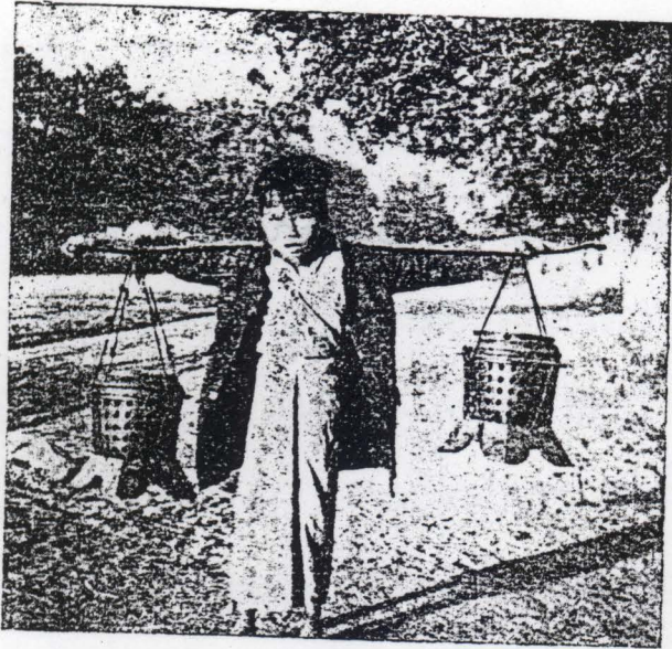
កូនសិស្សលោកសង្ឃនៅស្រុកភ្នំមា ហែសម្រាប់មកពីភូមិ ទៅវត្ត ។