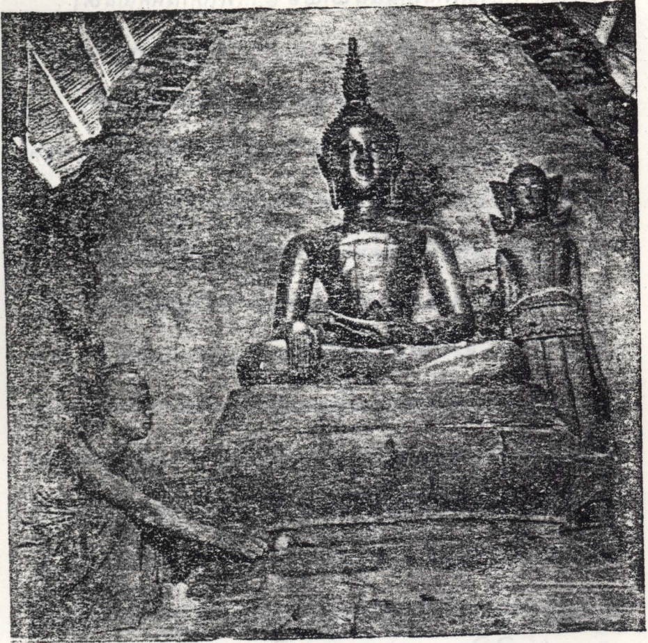
សាមនេរី (ប្រិយសាលា) ស្រុកបាទ-ណា-ម៉ាវ នេះព្រះពុទ្ធរូបដែលកសាងឡើងក្នុងសតវត្សរ៍ទី ១៧ គ្រឹះស្ថានសម្រាប់ នៅក្នុងហោព្រះ ។

ព្រះពុទ្ធសាសនា ទាំងអស់ ត្រូវបានសម្របសម្រួល ឲ្យស្របតាម វប្បធម៌ និង ទម្លាប់ របស់ ប្រជាជន ក្នុង តំបន់ ទាំងនោះ ។