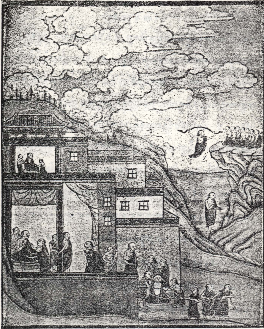
លោកអ្នកមានប្រវត្តិអាចចម្លែងរាងកាយបានតាមចំណង់