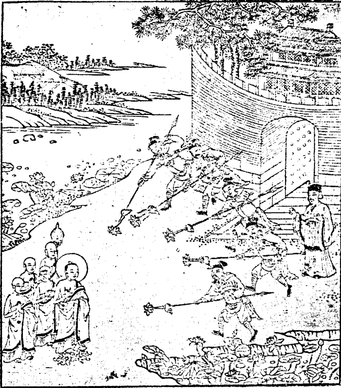
၈၄ - အင်္ဂါကားငြိမ်းချွမ်းဝိညာဉ်ပေးပုံပိုက်: