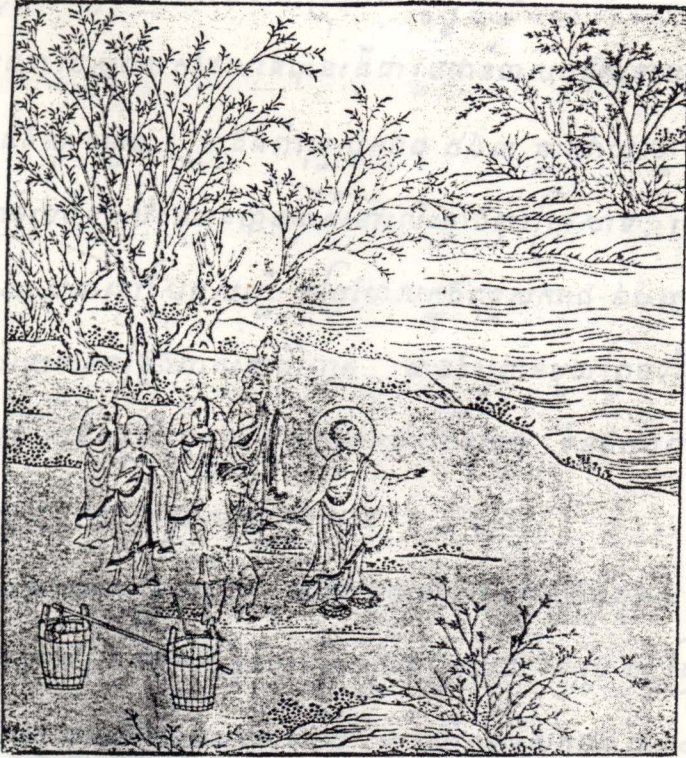
៣៧ — អំពីការទ្រង់ទ្រាយចិត្តគំនិតរបស់អ្នកស៊ីឈ្នួលចាក់លាមក

រាជវាំងសម័យបុរាណសង្គ្រាមសម័យបុរាណ ១៩១១ ជាដើមទៅ រដ្ឋបាលសម័យបុរាណ បានឃើញថាសង្គ្រាមសម័យបុរាណសង្គ្រាមសម័យបុរាណសង្គ្រាមសម័យបុរាណសង្គ្រាមសម័យបុរាណ ១៩២៧ រដ្ឋបាលសម័យបុរាណសង្គ្រាមសម័យបុរាណសង្គ្រាមសម័យបុរាណសង្គ្រាមសម័យបុរាណ