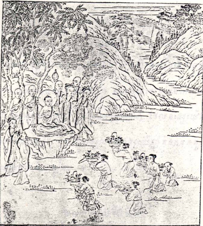
៣៧ - អំពីការបូជាភ្នំ

វិទ្យុនៃសម្មាសម្ពុទ្ធ ភ្នំព័ទ្ធជ័យវិបស្សនា (៣៧)