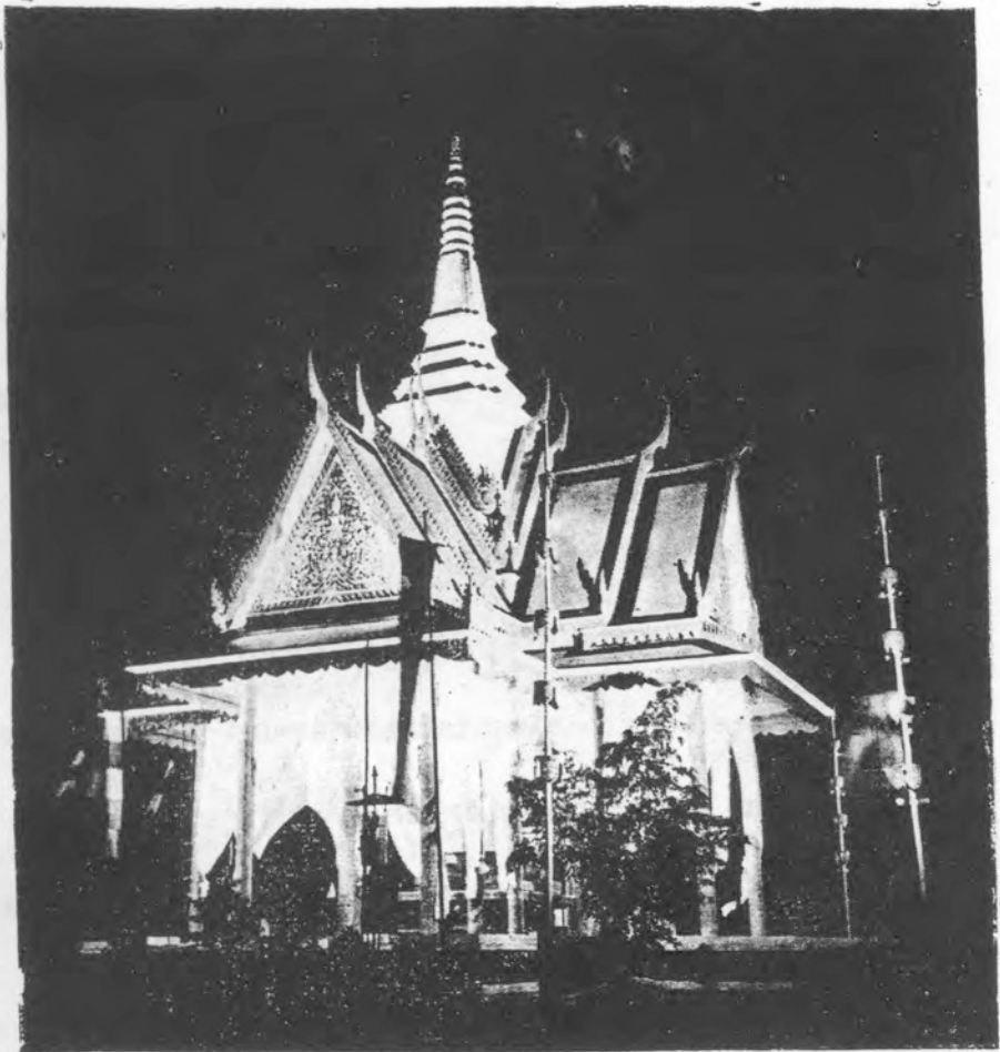
ឈាបនដ្ឋានសំរាប់បូជាព្រះសព្វព្រះសុមង្គលសីលាចារ្យ ទិត ទឹម អតីតមេគណ ទេត្តស្មៀមរាប ។ ឈាបនដ្ឋាននេះទុកសំរាប់សាធារណជន ។