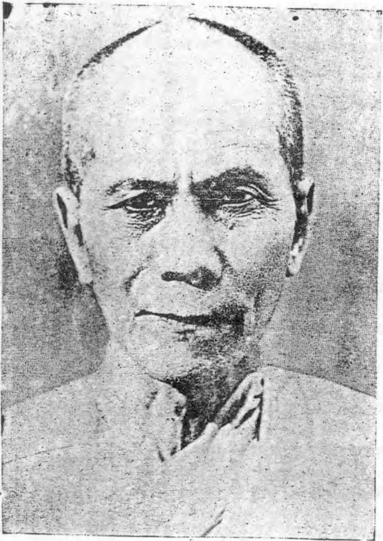
ព្រះសុមង្គលសីលាចារ្យ ភគវរណៈ មេតណ ទិត ទម បោសិកា វិទ្យាសាលា សៀមរាប ជាតិថ្ងៃអាទិត្យ វៃស្រាពណ៍ ឆ្នាំចូរ ព.ស. ២៤៣១ សុតតនៅថ្ងៃអាទិត្យ ១២ រោច បវេសាសាធ ឆ្នាំចូរត្រីស័ក ព.ស. ២៥០៤ ត្រូវនឹងថ្ងៃទី ៩ ខែកក្កដា ឆ្នាំ ១៩៦១ វេលាម៉ោង ១៤ ។