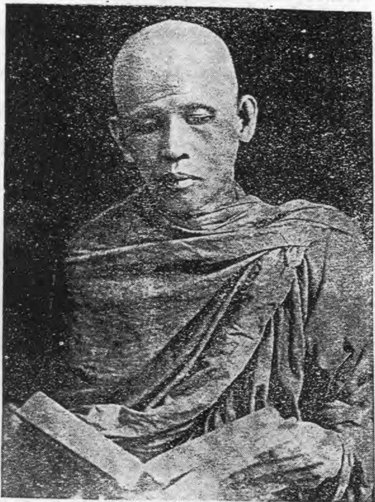
ព្រះឧត្តមមុនី អ៊ឹម.ស៊ីវ