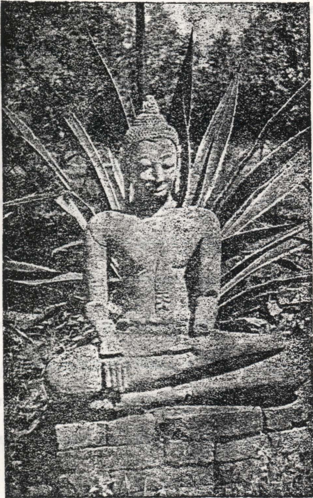
ព្រះពុទ្ធសាសនា — នេះព្រះពុទ្ធរូបសម័យអង្គរ

នេះគឺជាព្រះពុទ្ធសាសនាដែលបានរីកចម្រើននៅក្នុងប្រទេសកម្ពុជា។