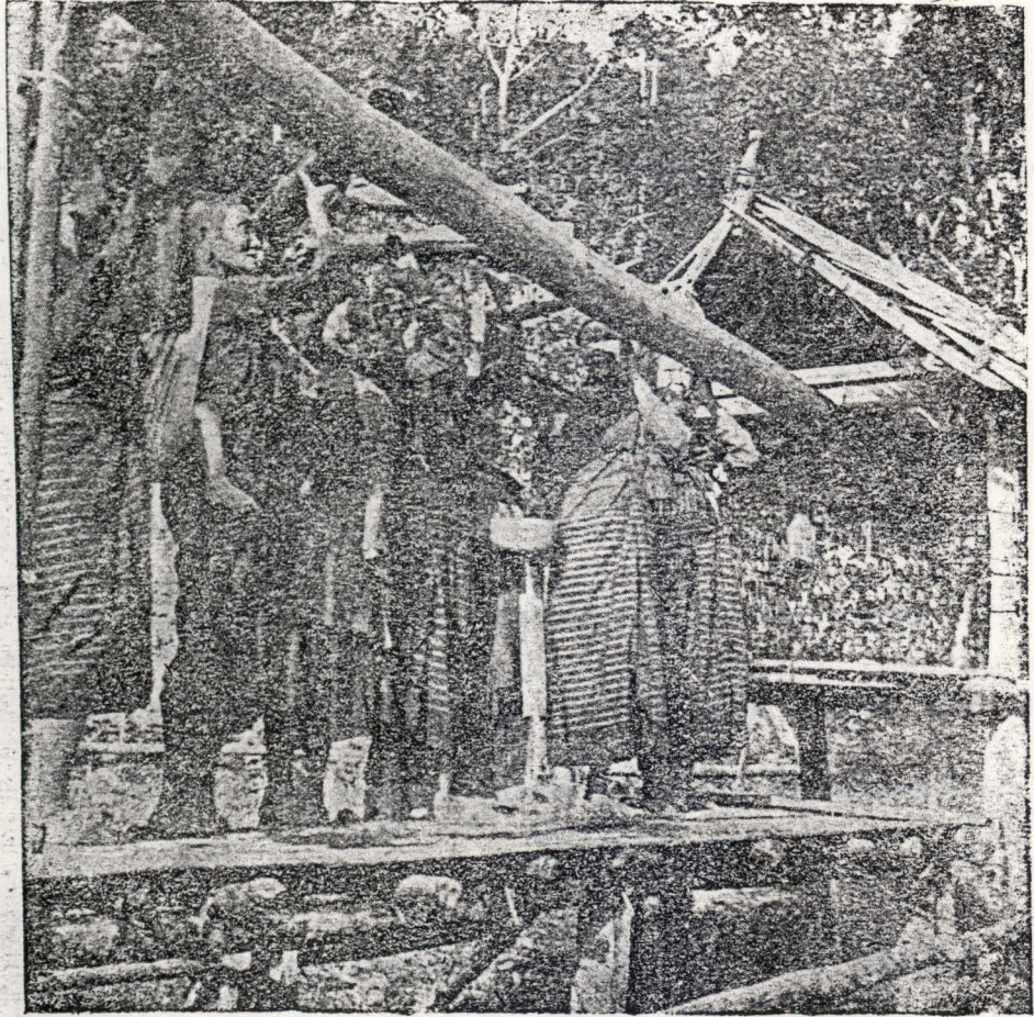
សាមឡឿ (ប្រឹទ្ធសាលារ) - គីឡូម៉ែត្រស្របក្រុងព្រះពុទ្ធរូប ។