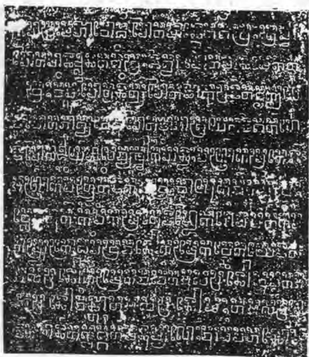
Nouvelle inscription du Biméānākas