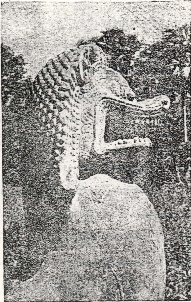
ប្រាសាទឃ្នាយ៉ន — រូបរាជសីហ៍នៅទ្វារចូលទិសខាងជើង ។