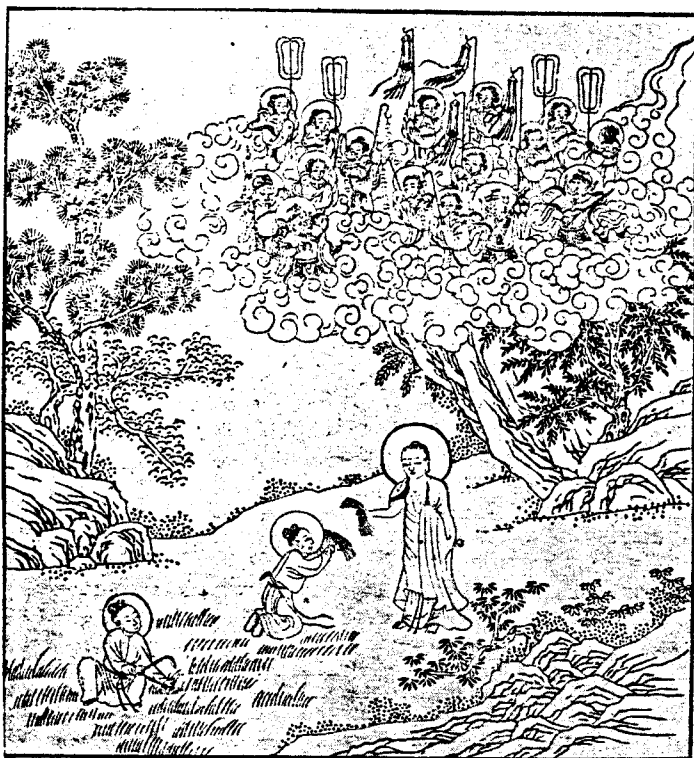
២២- អំពីទ្រង់ទទួលបានស្មារិចសំសុស្តិកត្រាហ្គុណ