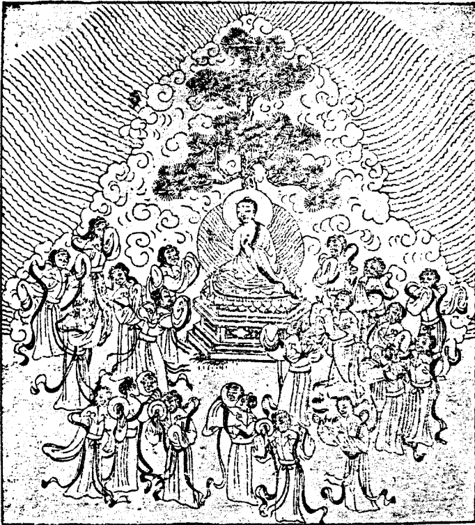
២៤ - អំពីបុត្រិនៃក្រុងមា