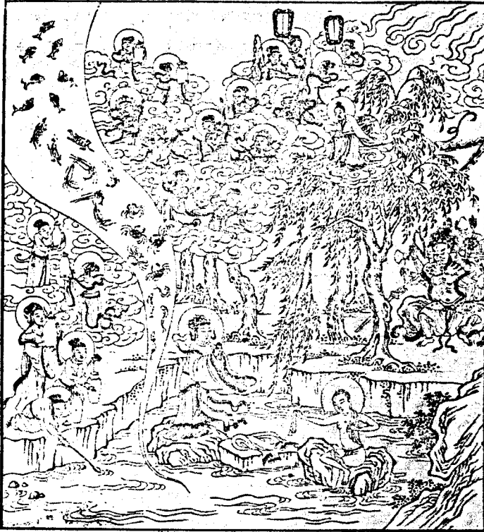
២១ - អំពីព្រះពោធិសត្វទ្រង់ស្រង់ទឹកដំបូង