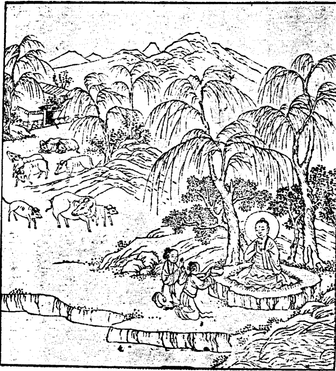
២០ — អំពីភាគីសុភាពង្វាយមុតយាស