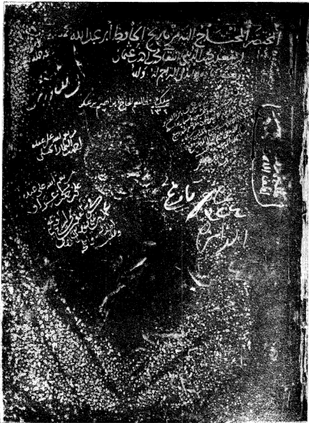
وجه الورقة التي فيها اسم المخطوط