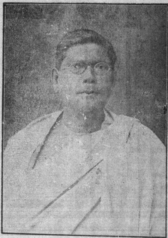
• দেশবন্ধু চিত্তবঞ্জনি দাস •