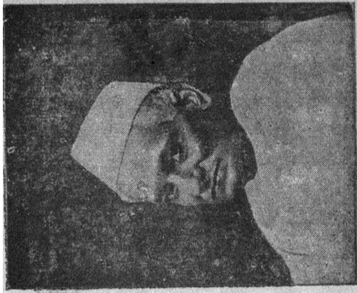
শ্রীশ্রী মতিলাল নেহরু