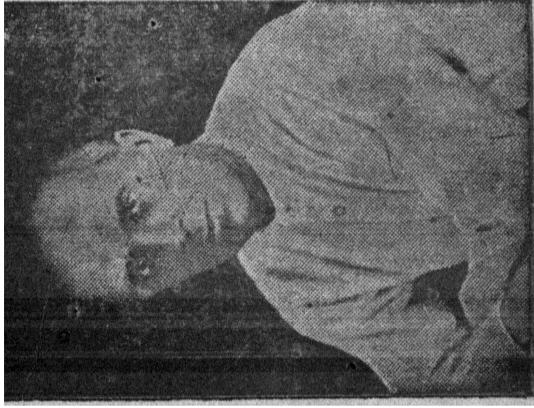
শ্রীশ্রী জহ্নলাল নেহরু