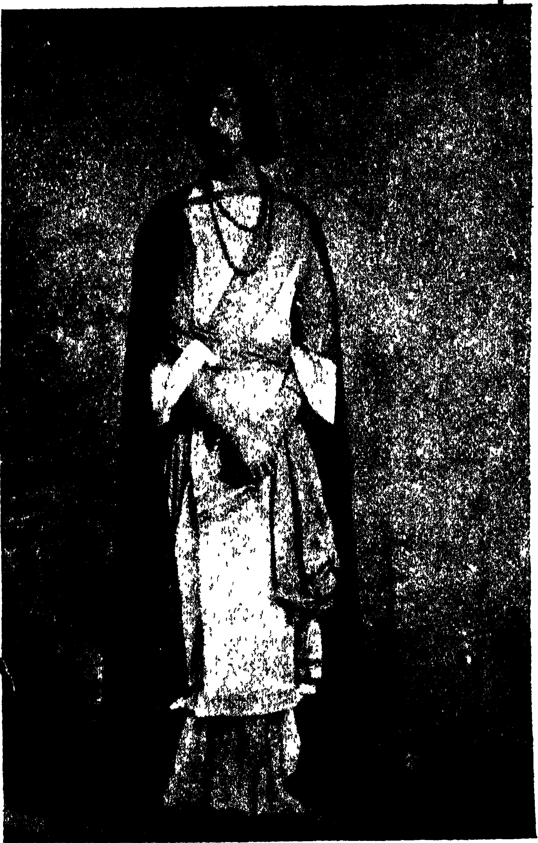
রবীন্দ্রনাথ . প্রথম 'বাল্মীকি-প্রতিভা' অভিনয়ে—বয়স ২০ বৎসর