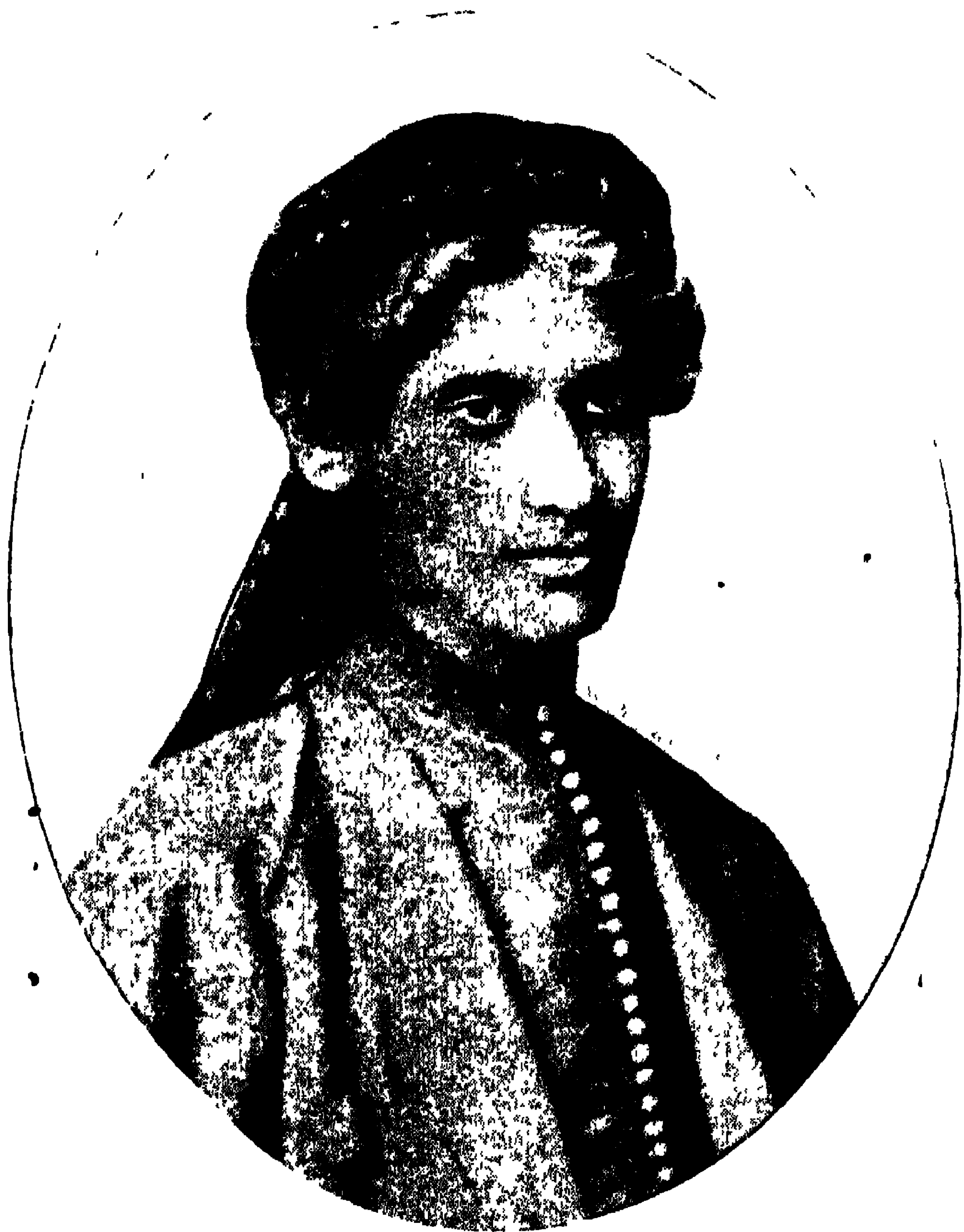
রবীন্দ্রনাথ ১৪ বৎসর বয়সে