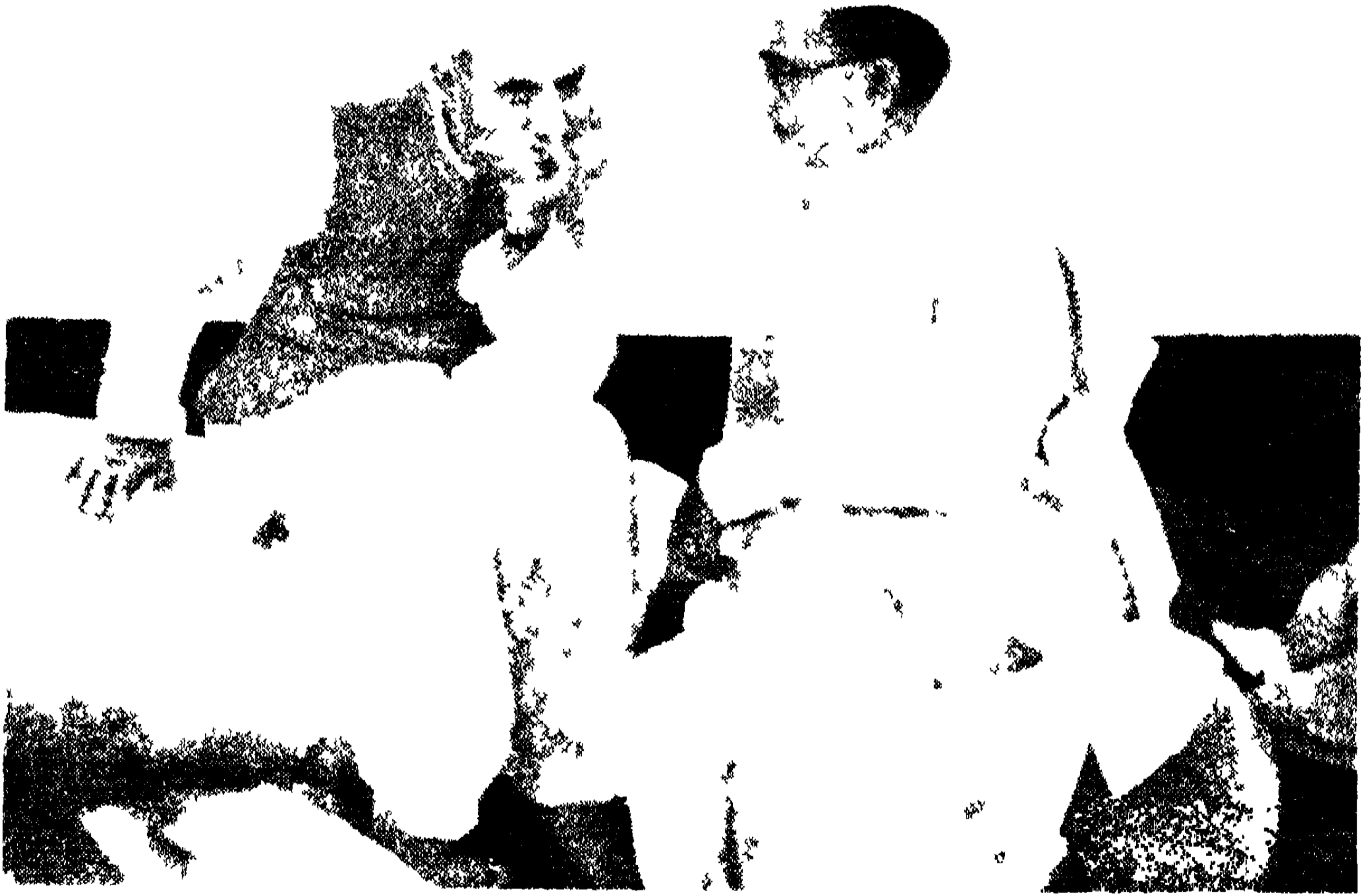
আলোচনাপত—সুভাষ ও জওহরলাল