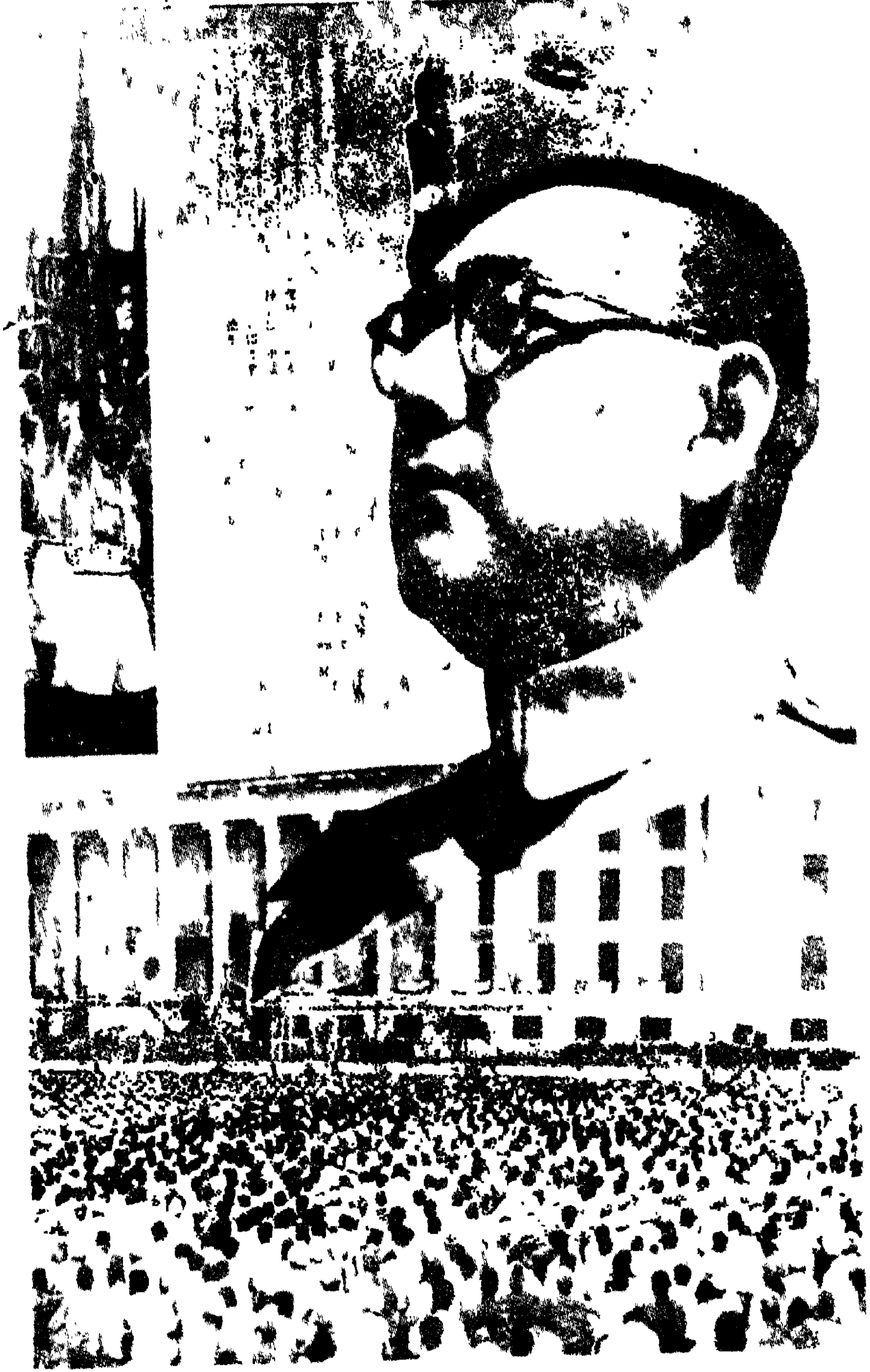
২১শে অক্টোবর ১৯৫৩ সাল সোনানে আজাদ হিন্দ সর্কার প্রতিষ্ঠার পূর্বে নেতাজীৱ প্রতিকৃতিসহ জনতার দৃশ্য