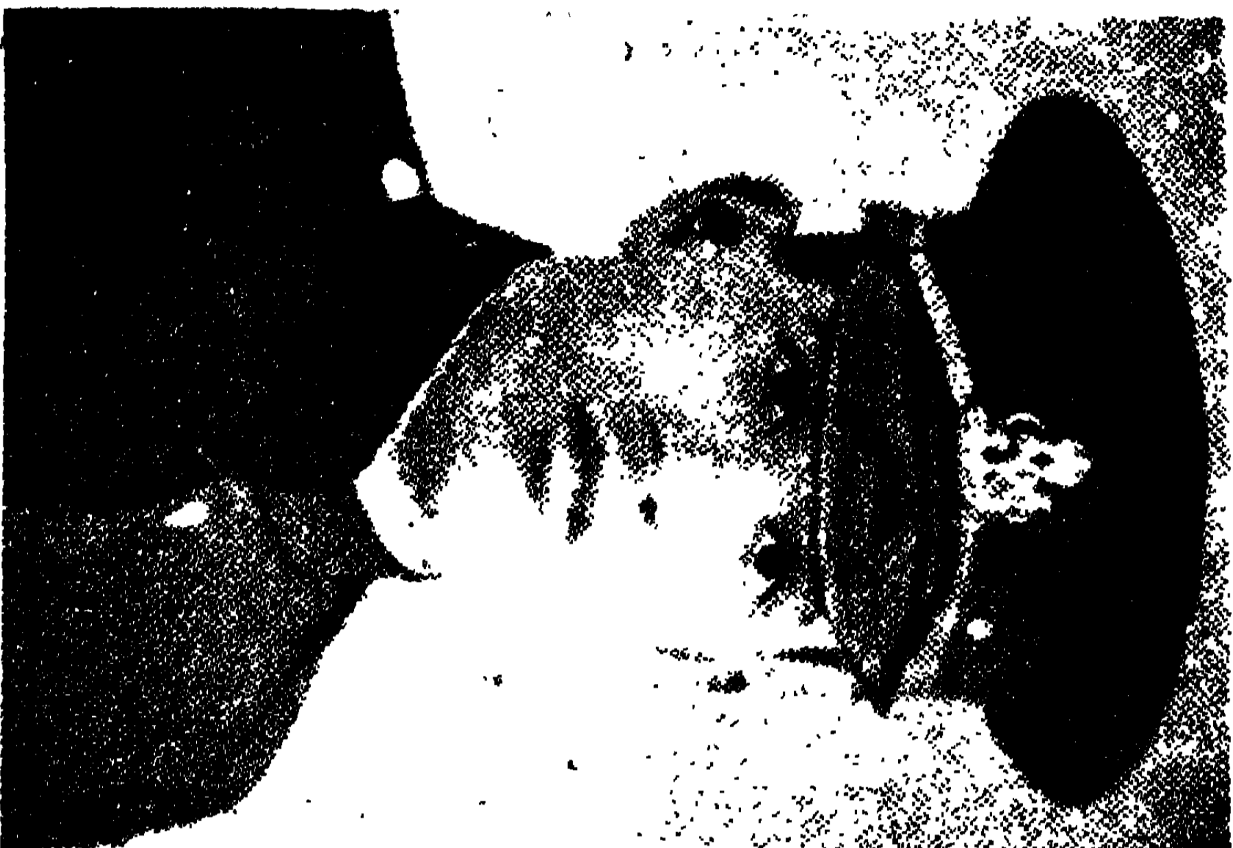
ମଃ କଃ ମେଗଜ