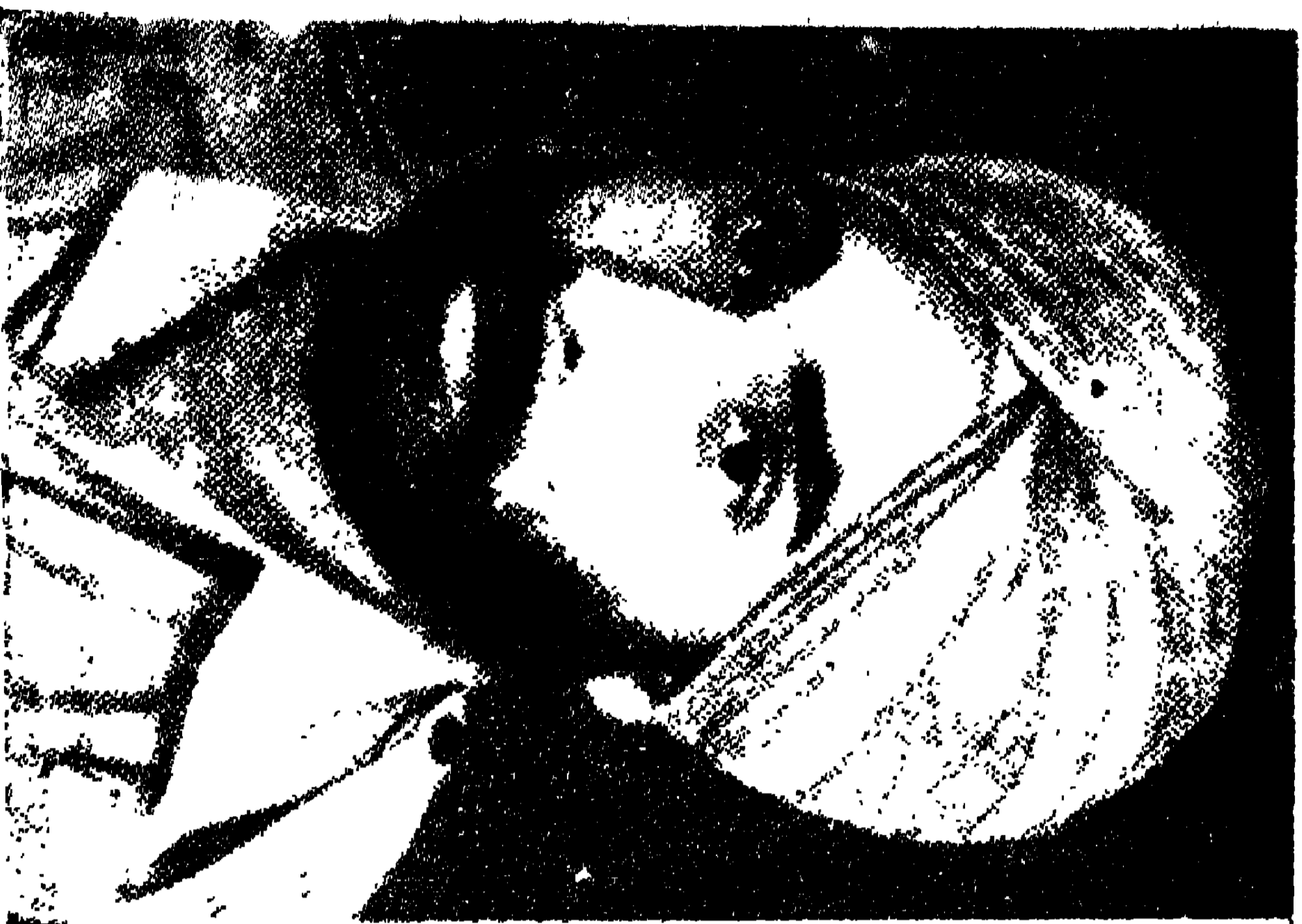
ଜେ: କ: ସୀତଲ