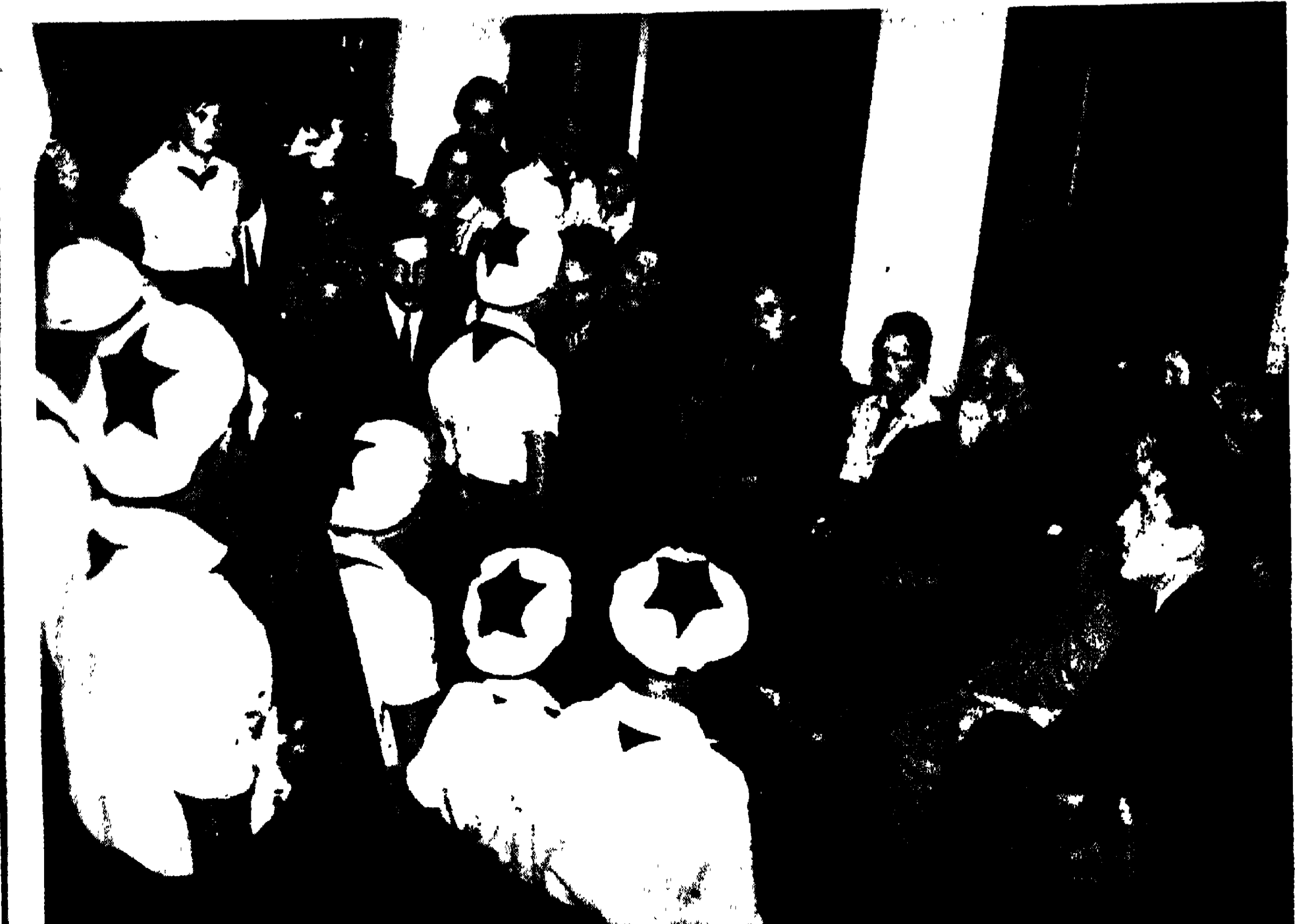
পায়োনিয়র্স্‌ কমনে আলাপ-আলোচনা