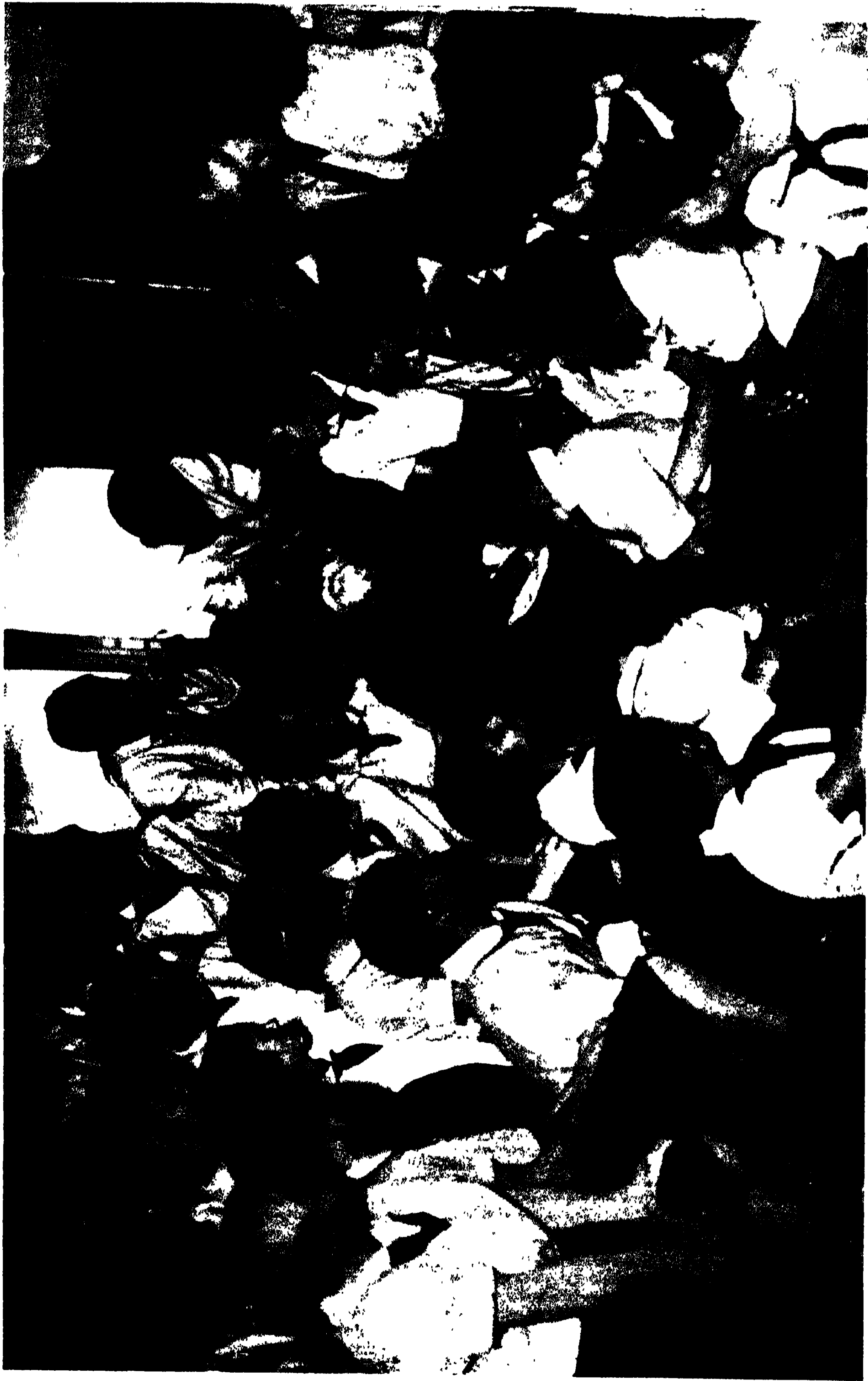
পায়োনিয়র ছাত্রছাত্রীগণকর্তৃক রবীন্দ্রনাথের সংবর্ধনা