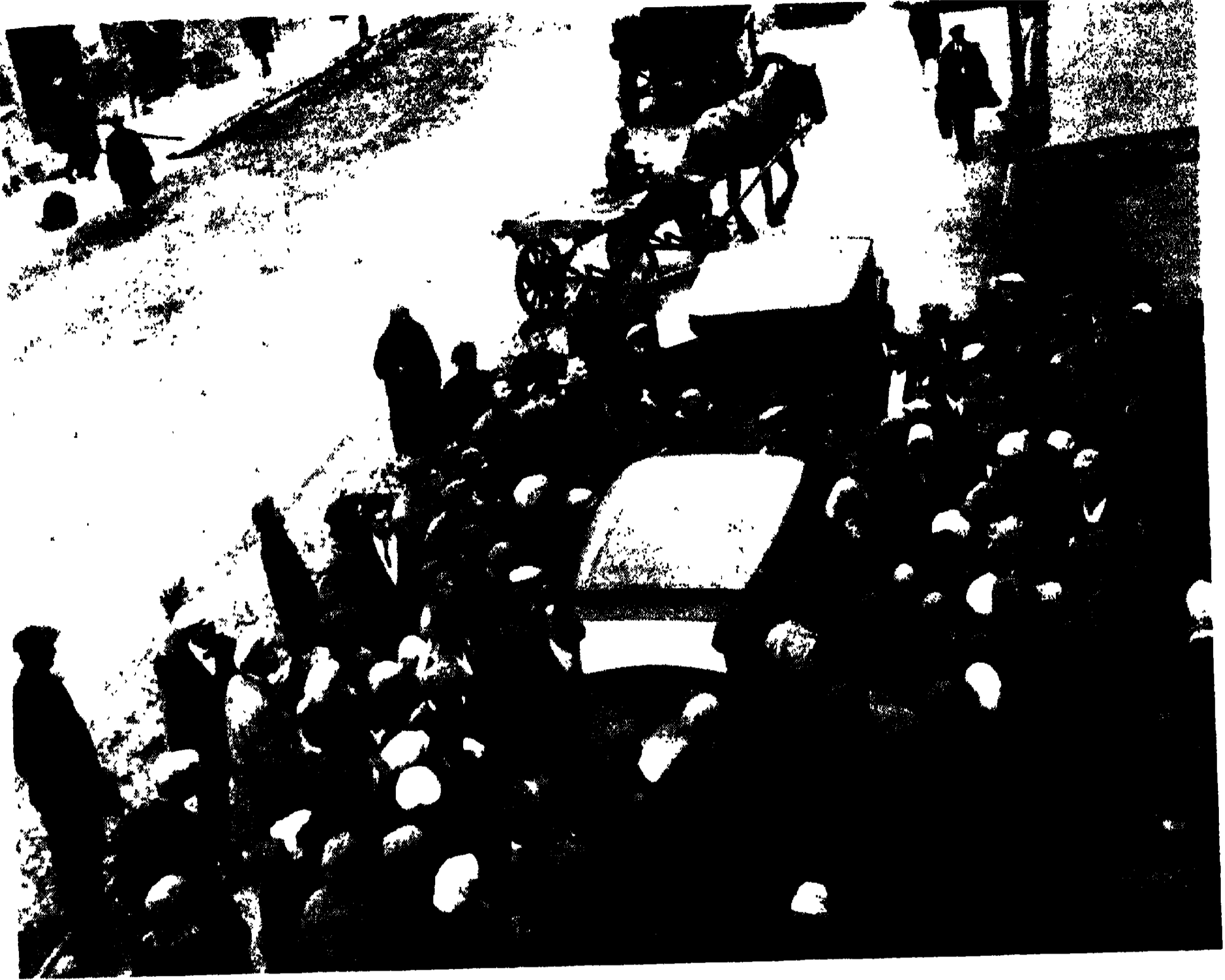
রবীন্দ্রচিত্রপ্রদর্শনীতে কবির আগমন