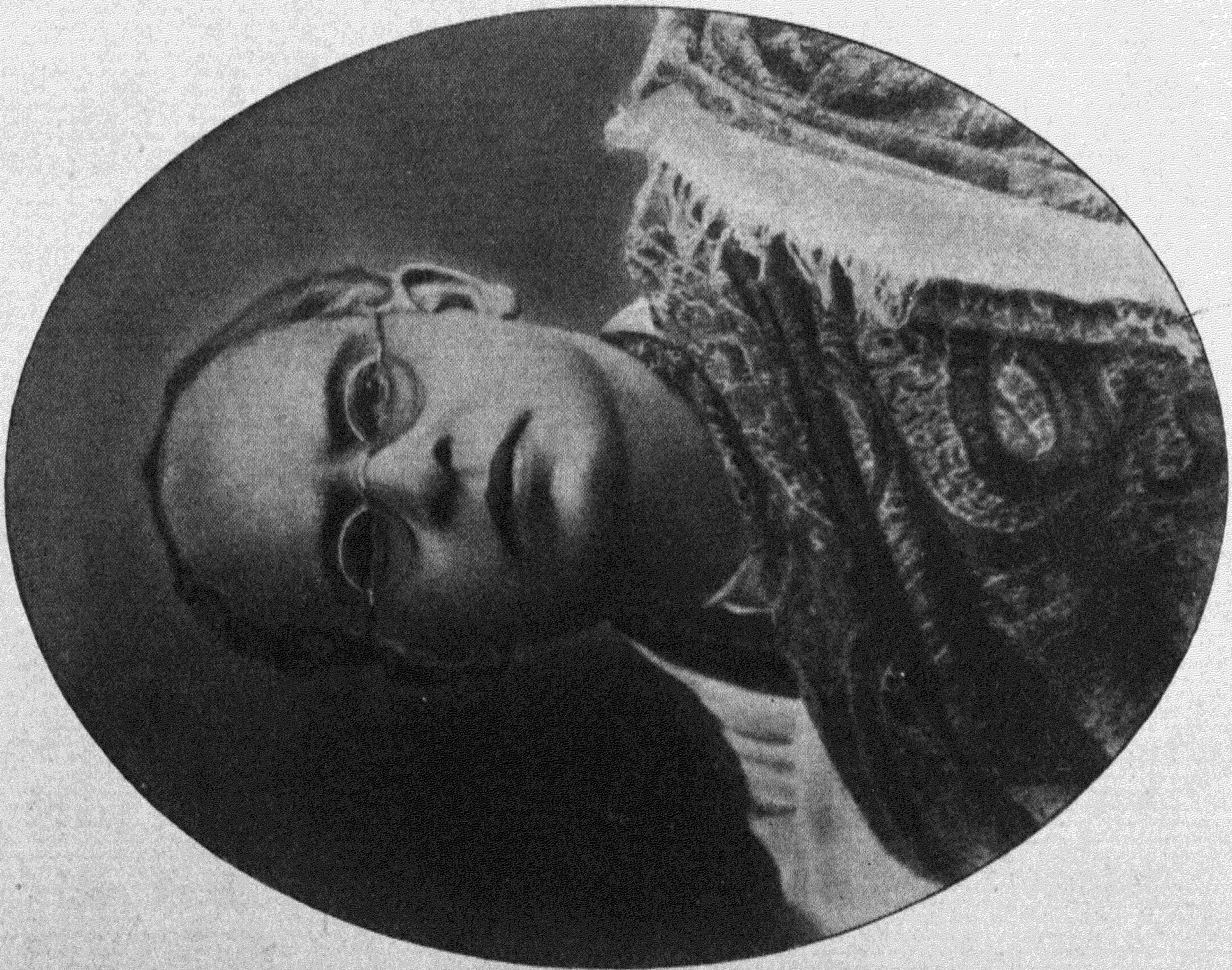
কবি ও কবি-জায়া