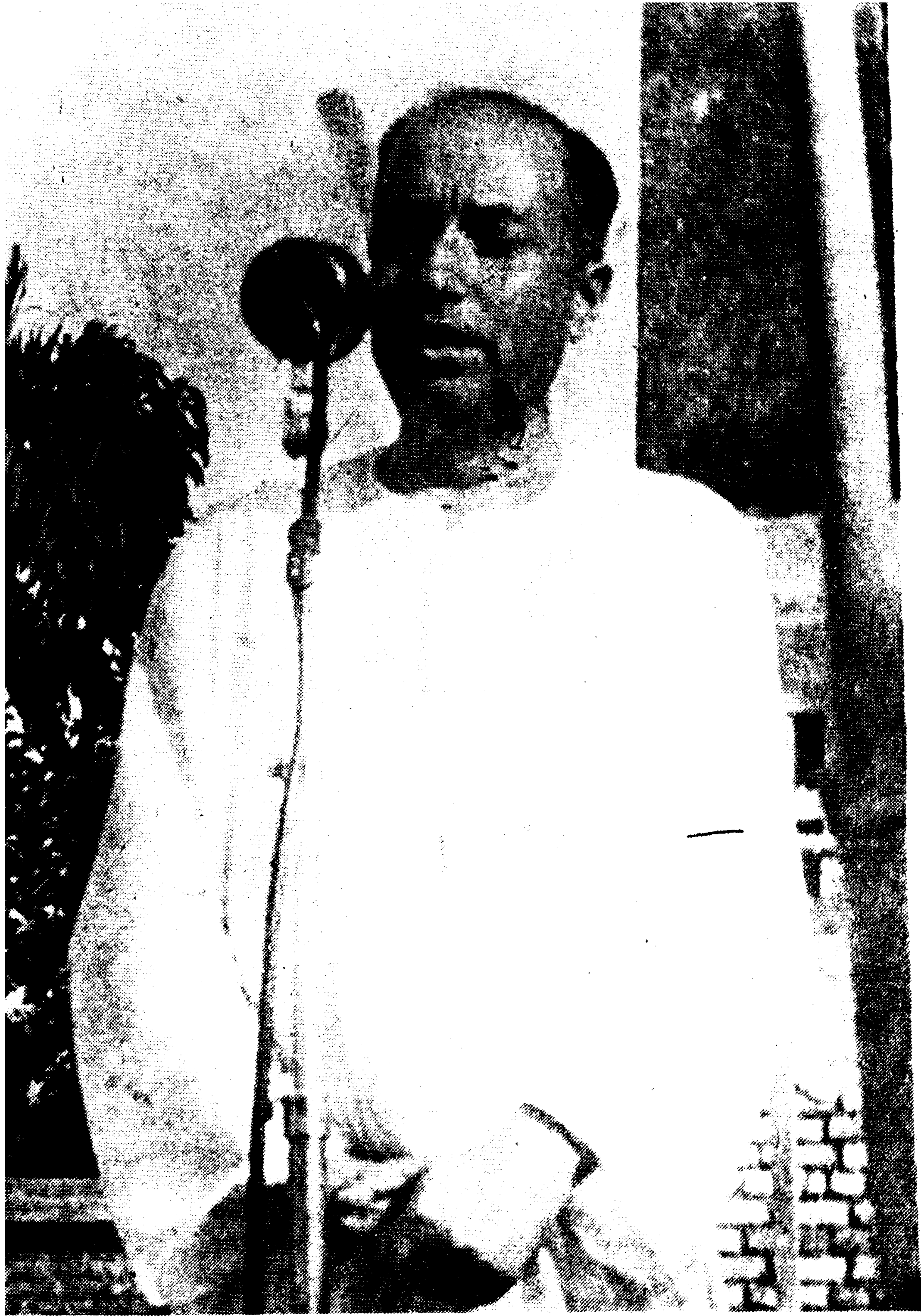
বিপ্লবী-নায়ক প্রতুলচন্দ্র গাঙ্গুলী