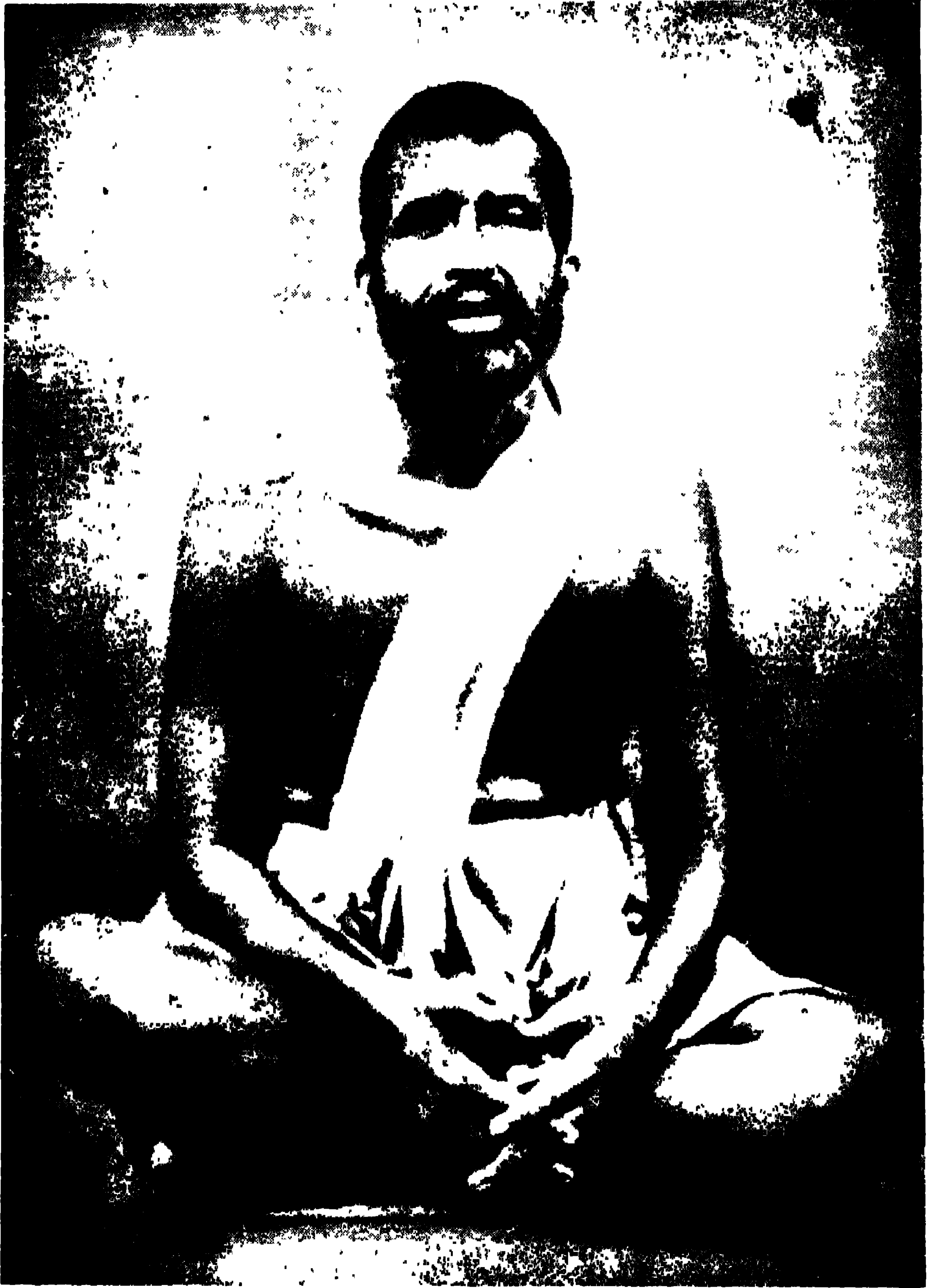
শ্রী শ্রীরামকৃষ্ণ পরমহংসদেব