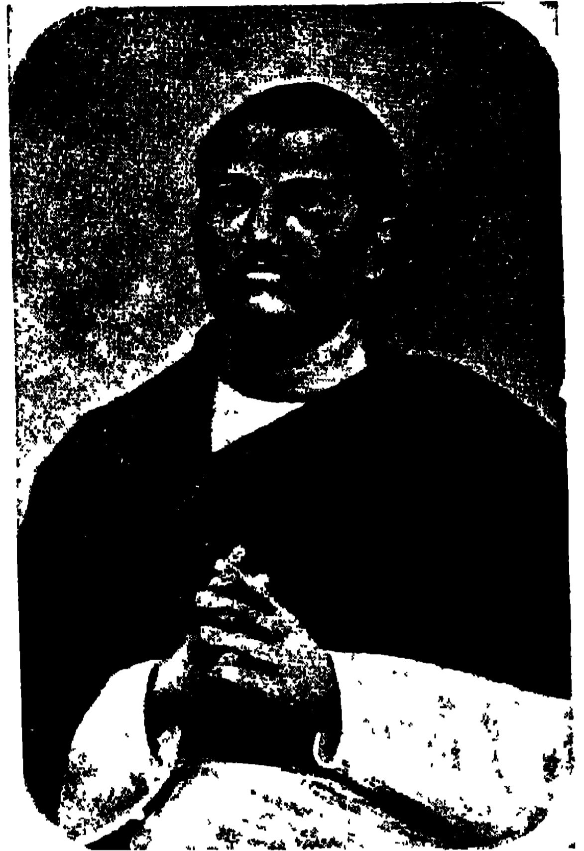
শ্রীযুক্ত কেশবচন্দ্র সেন ।