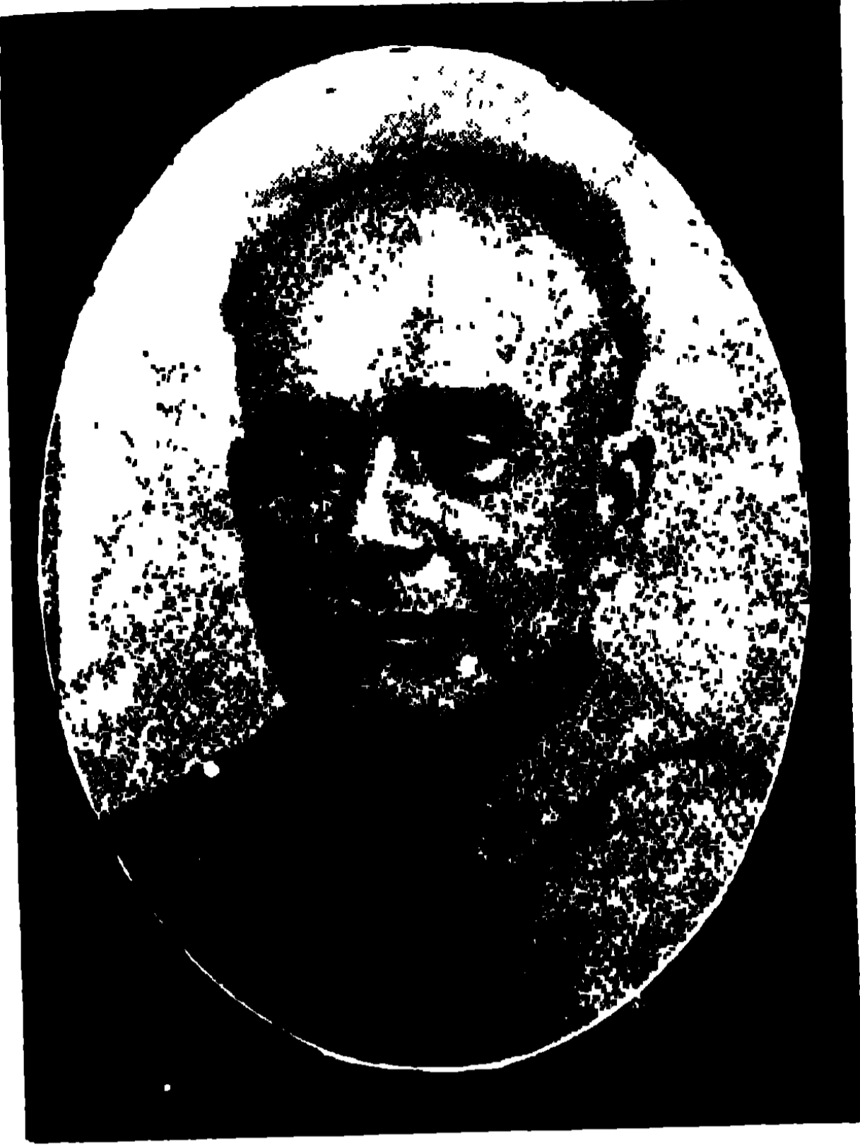
শ্রীযুক্ত ঈশ্বরচন্দ্র বিদ্যাসাগর