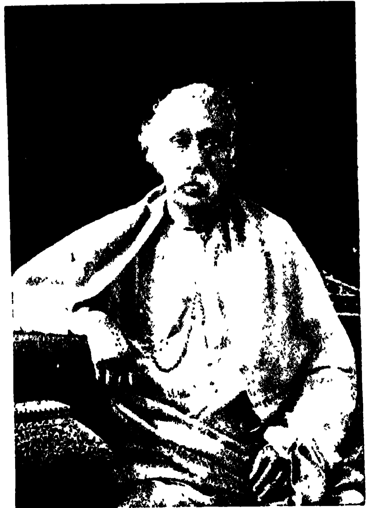
ডাক্তার শ্রীযুক্ত মহেন্দ্রলাল সরকার ।