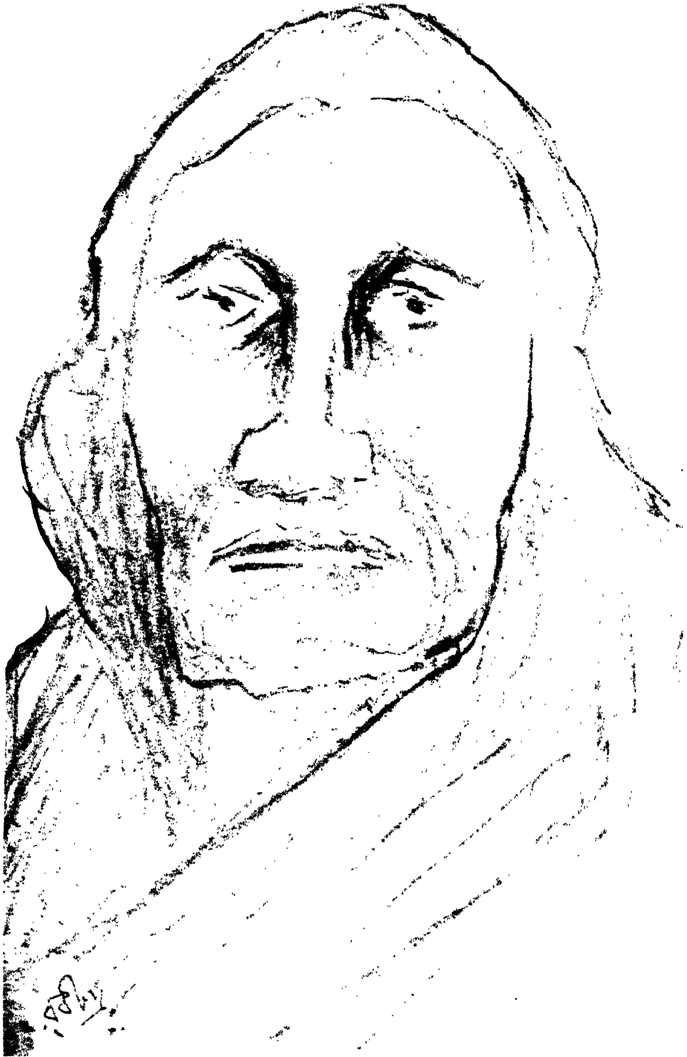
কালুবড়ি কবিতাসংখ্যা ১