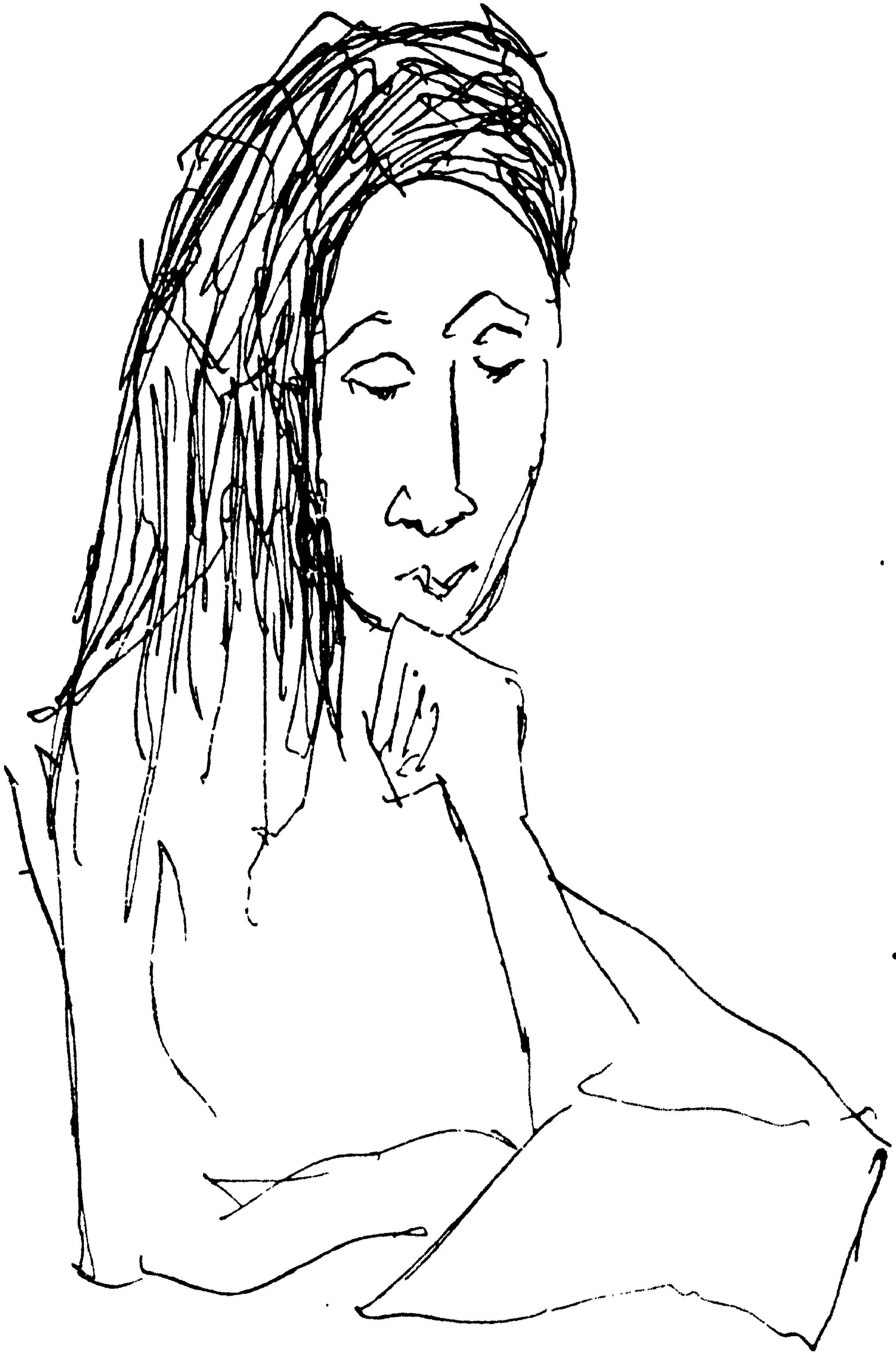
স্ত্রীর বোন কবিতাসংখ্যা ৬১