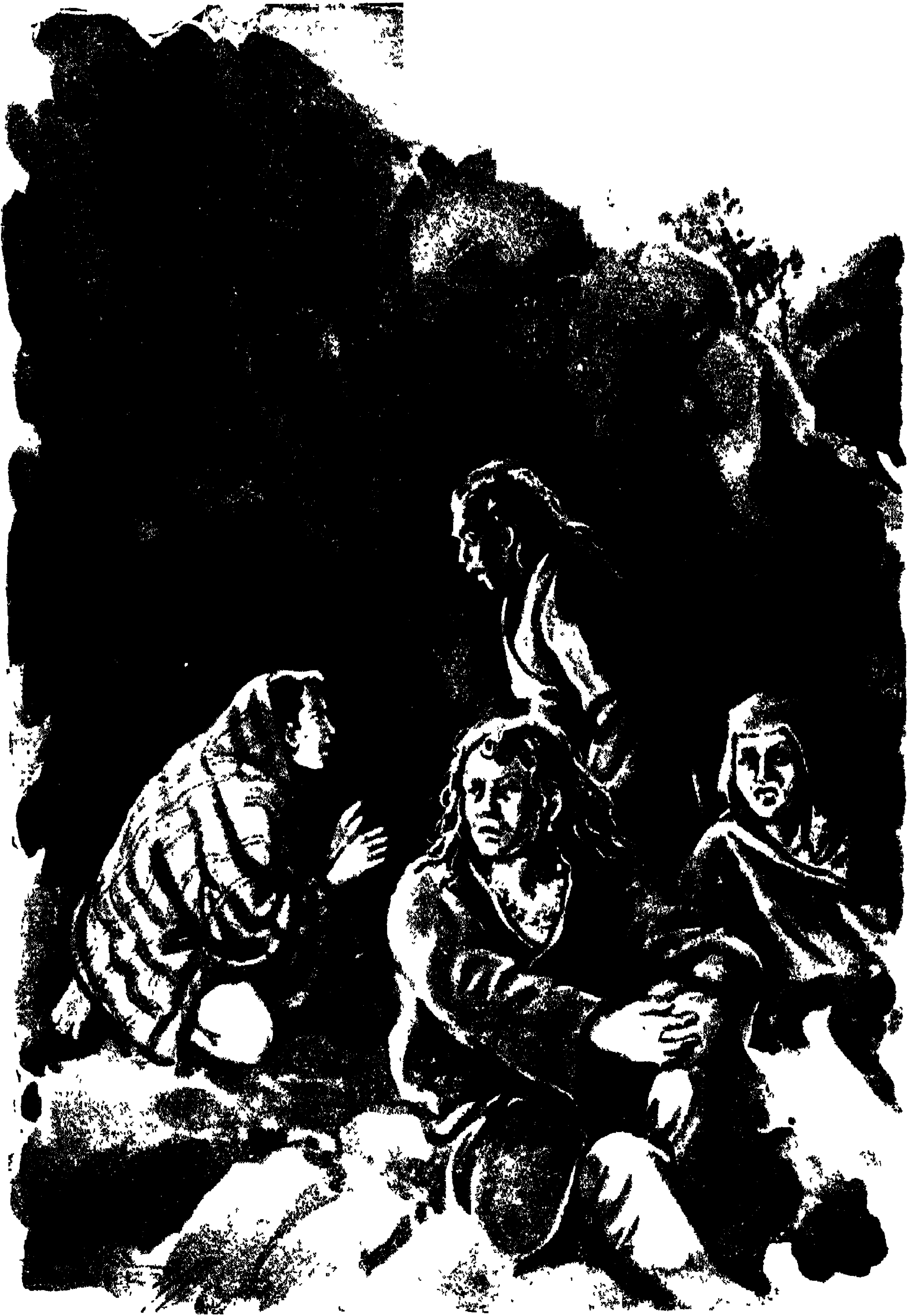
হরেন ডাকিল—বন্ধু, ...ত্র্যম্বক বলিল—ইয়েস্