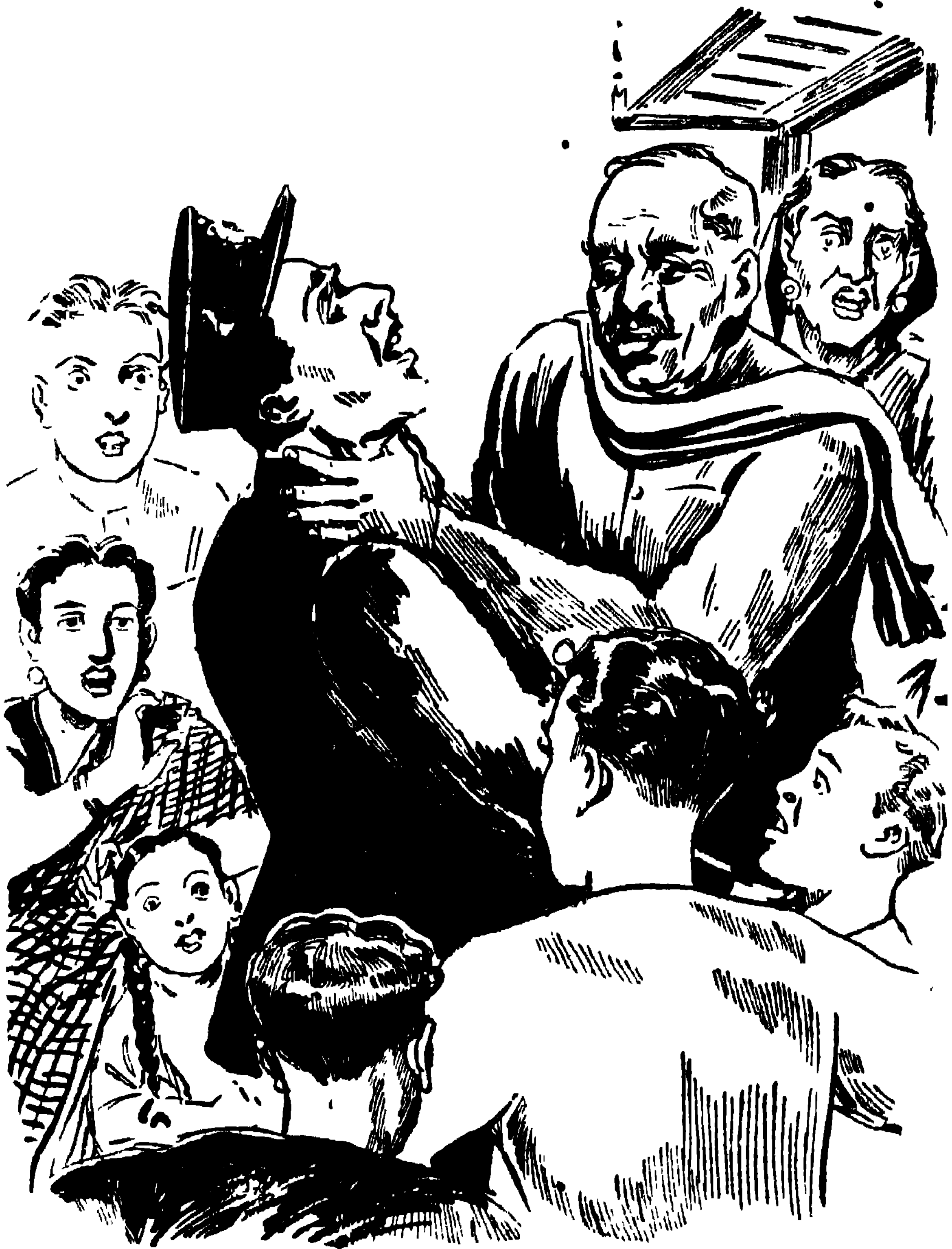
চেকারবাবুর গলা টিপে ধরলেন