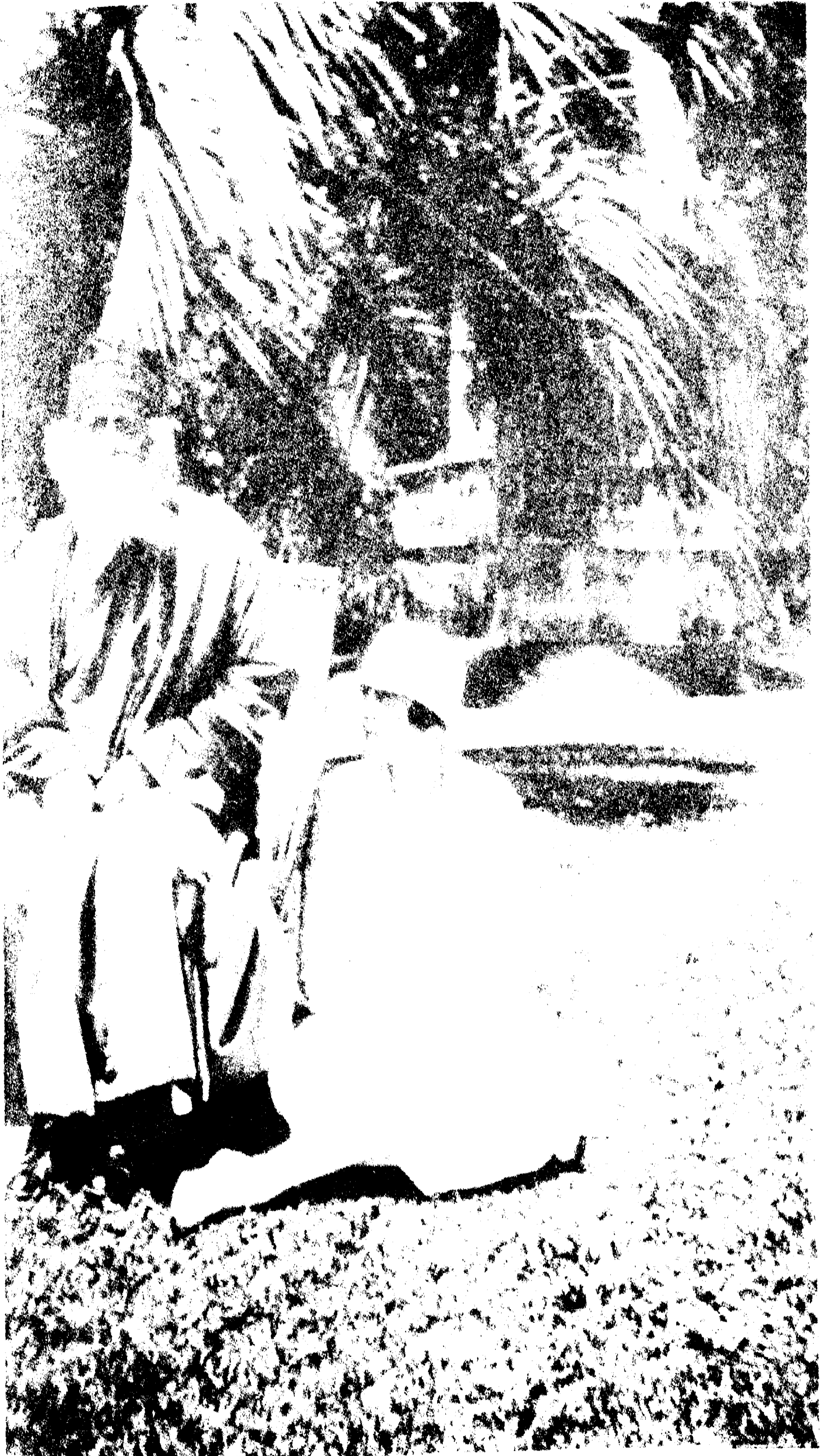
রবীন্দ্রনাথ ও 'বিজয়া' ভিক্টোরিয়া ওকাম্পো