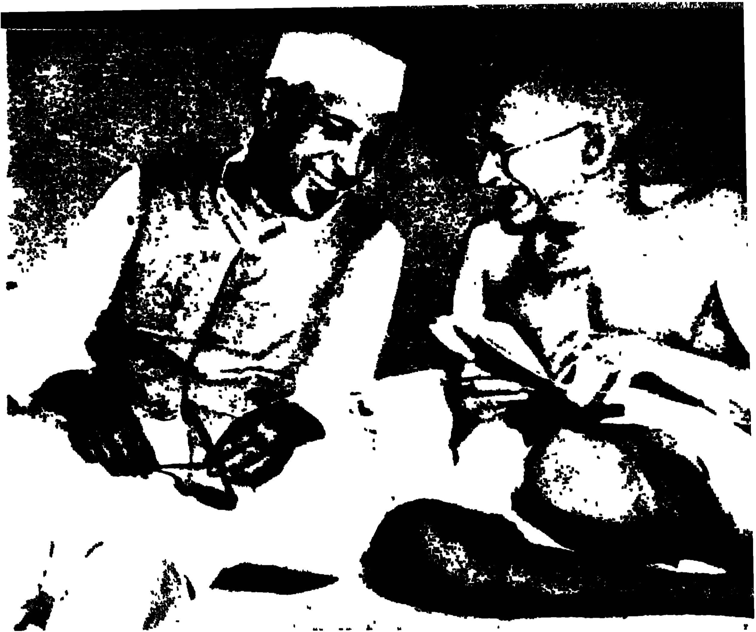
ମା, ପୁତ୍ର ଓ ମାତୃକା ଓ ମାତୃକା ମା, ପୁତ୍ର