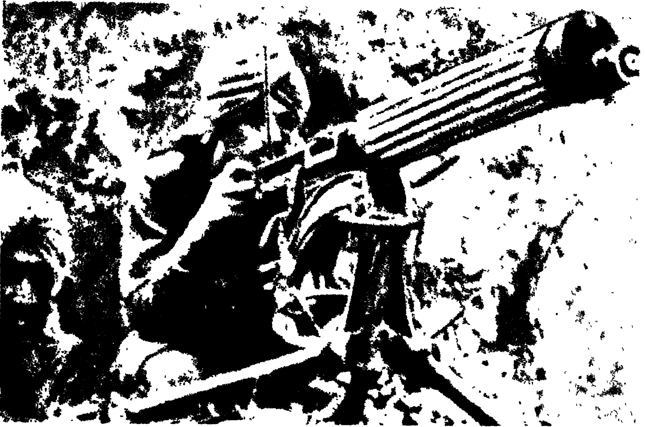
আজাদ হিন্দ ফৌজের মেশিন গানার