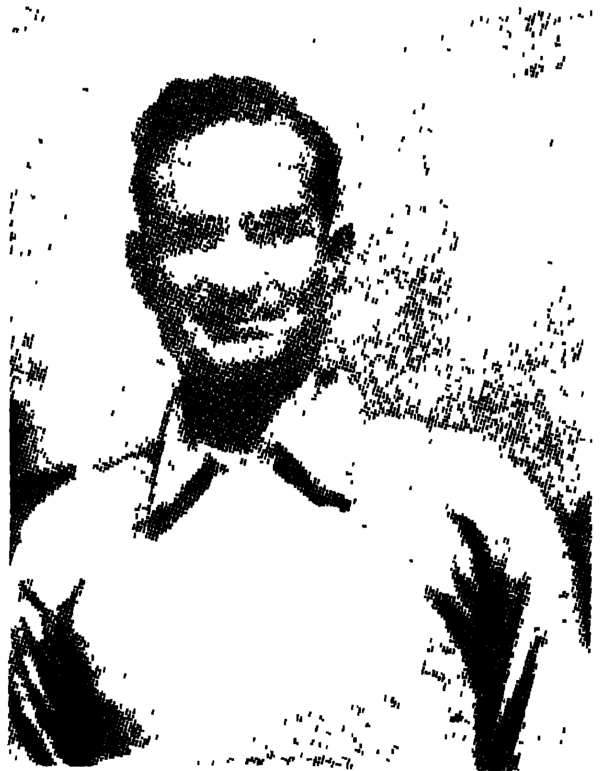
মেজর জে: কিয়ানি