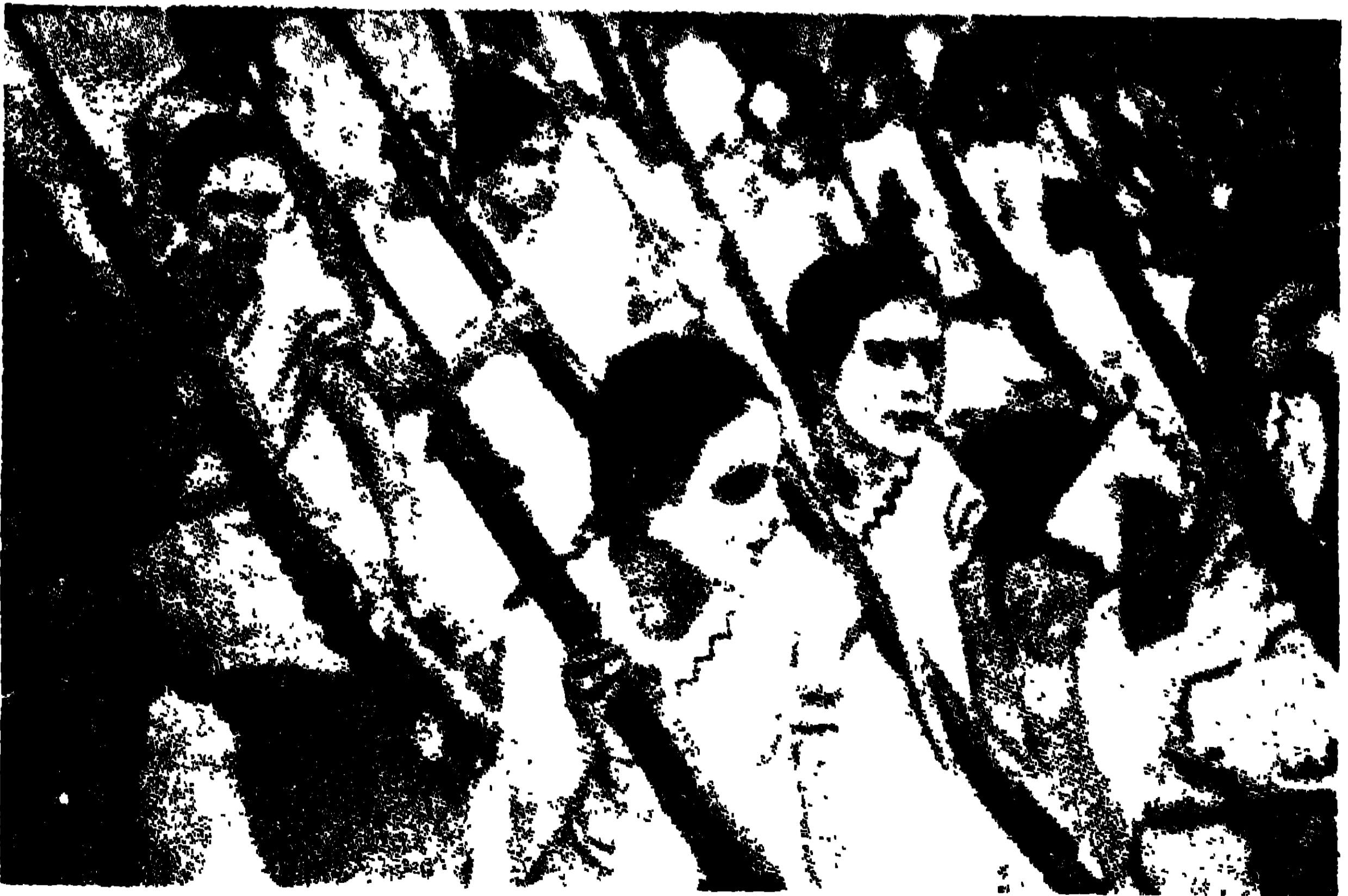
বাঁসির বাণী রেজিমেন্টের শিক্ষার্থিনী