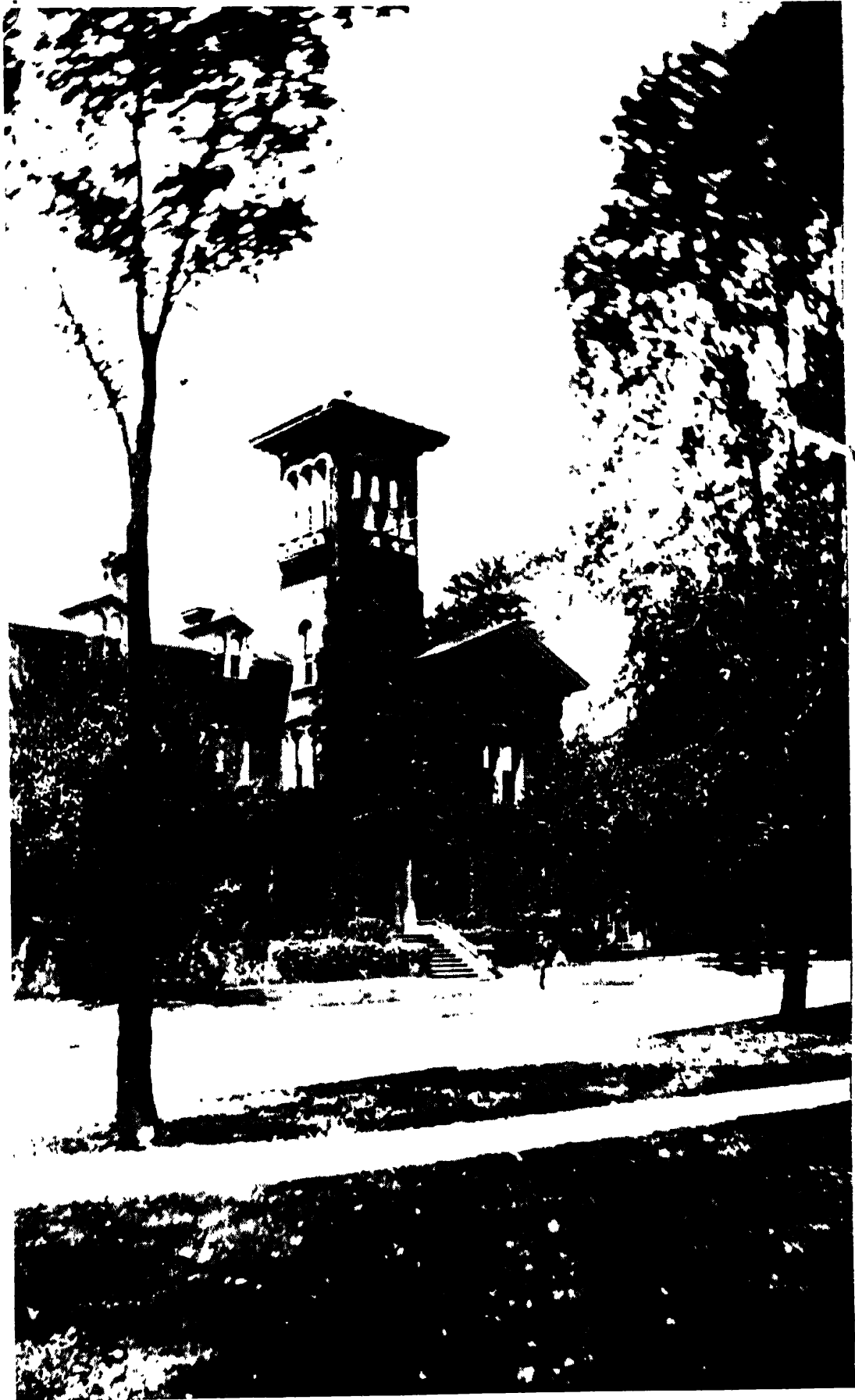
মিসেস ব্যাগলির বাটা, ডেট্রয়েট