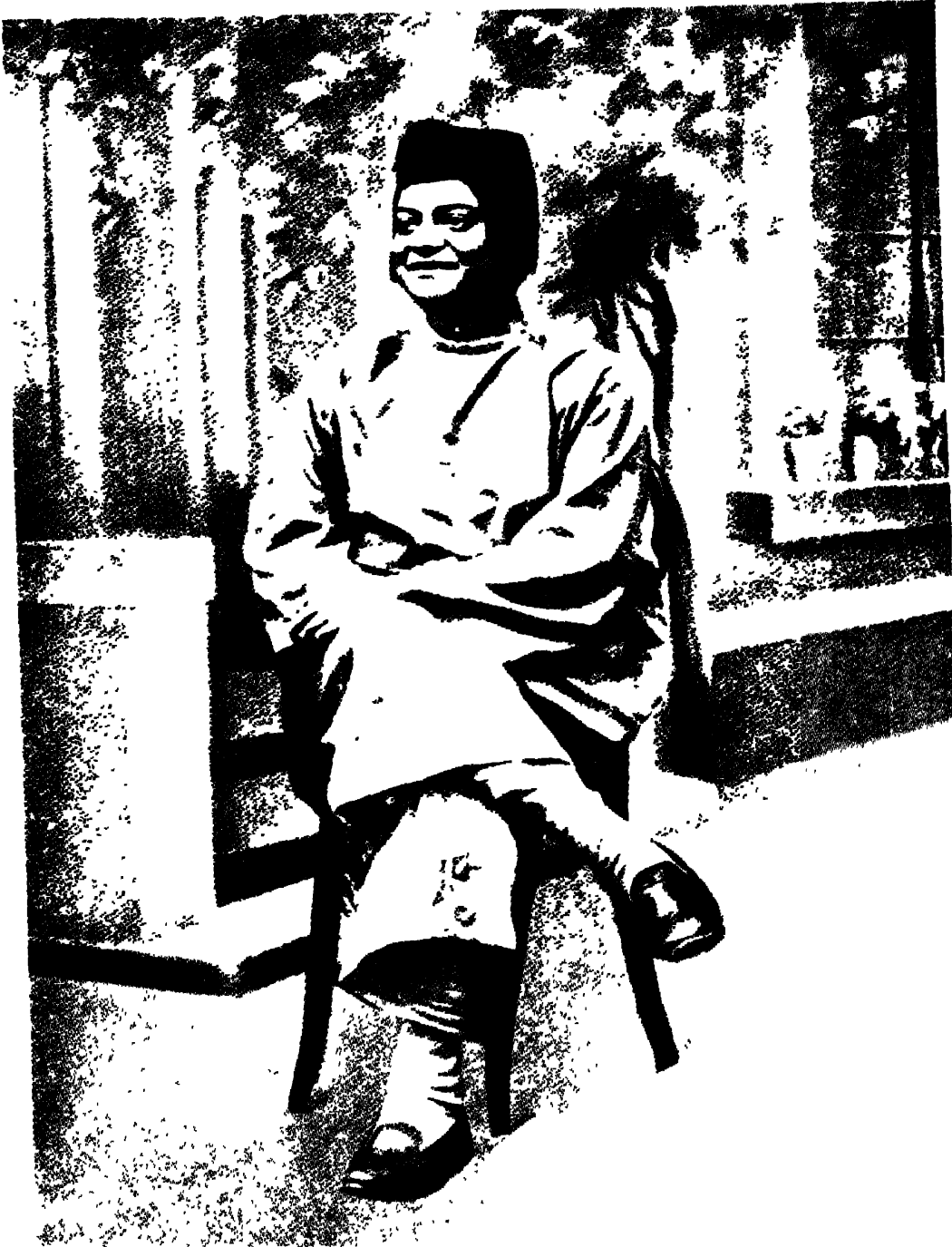
শিলং-এ স্বামীজী, ১৯০১