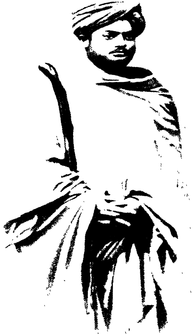
খেতড়িতে স্বামীজী, ১৮৯১