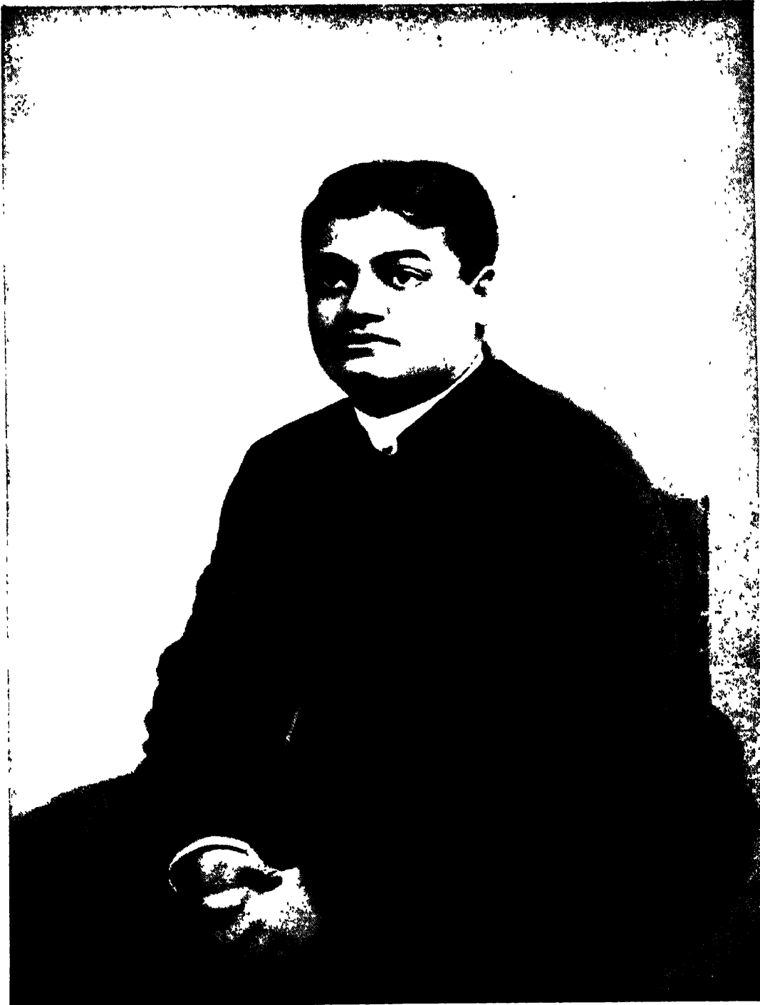
লগনে স্বামীজী, ১৮৯৬