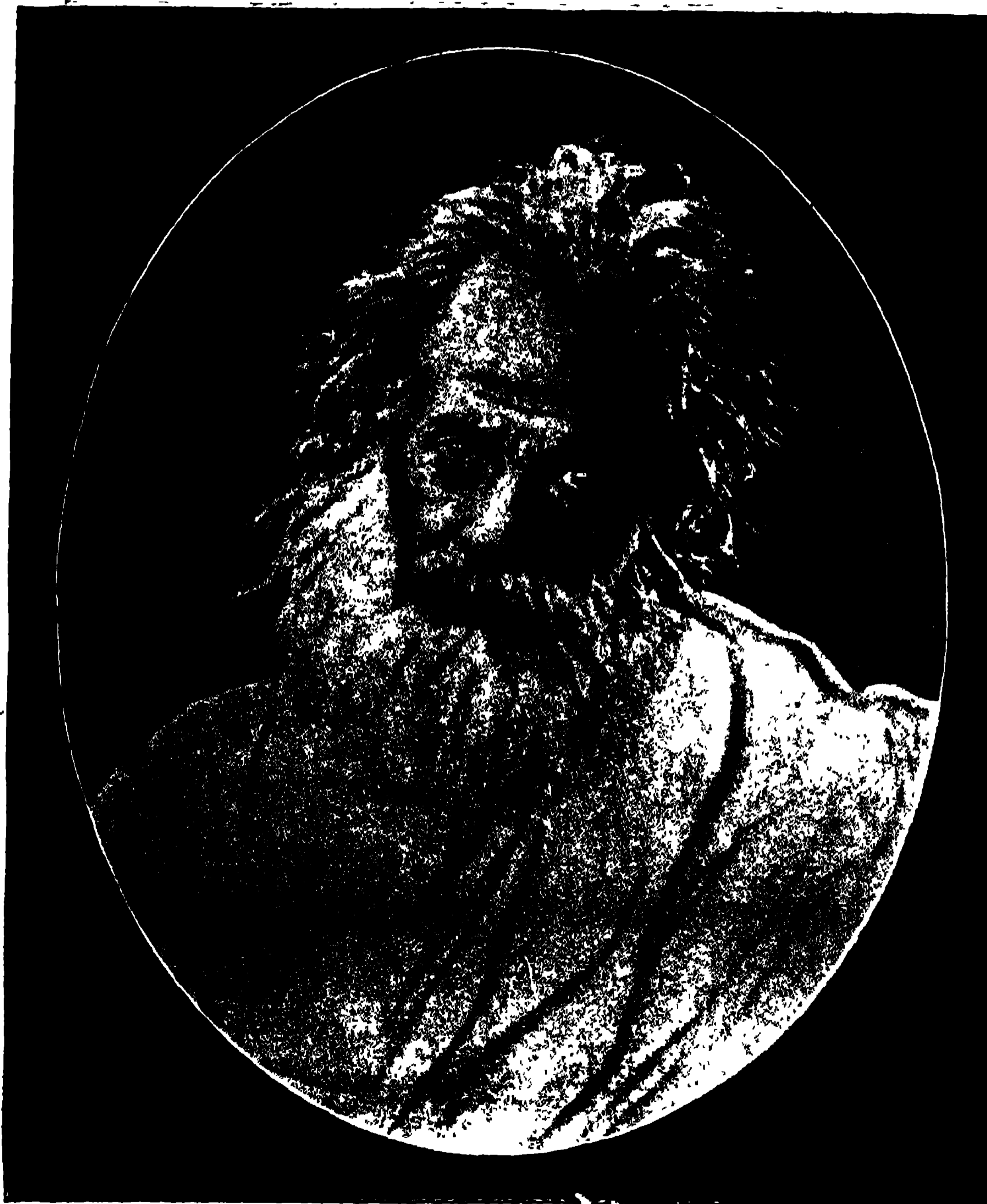
স্বদেশ-প্রেমিক, কবি ও সাধক প্রবর ৩শরচ্ছন্দ ।