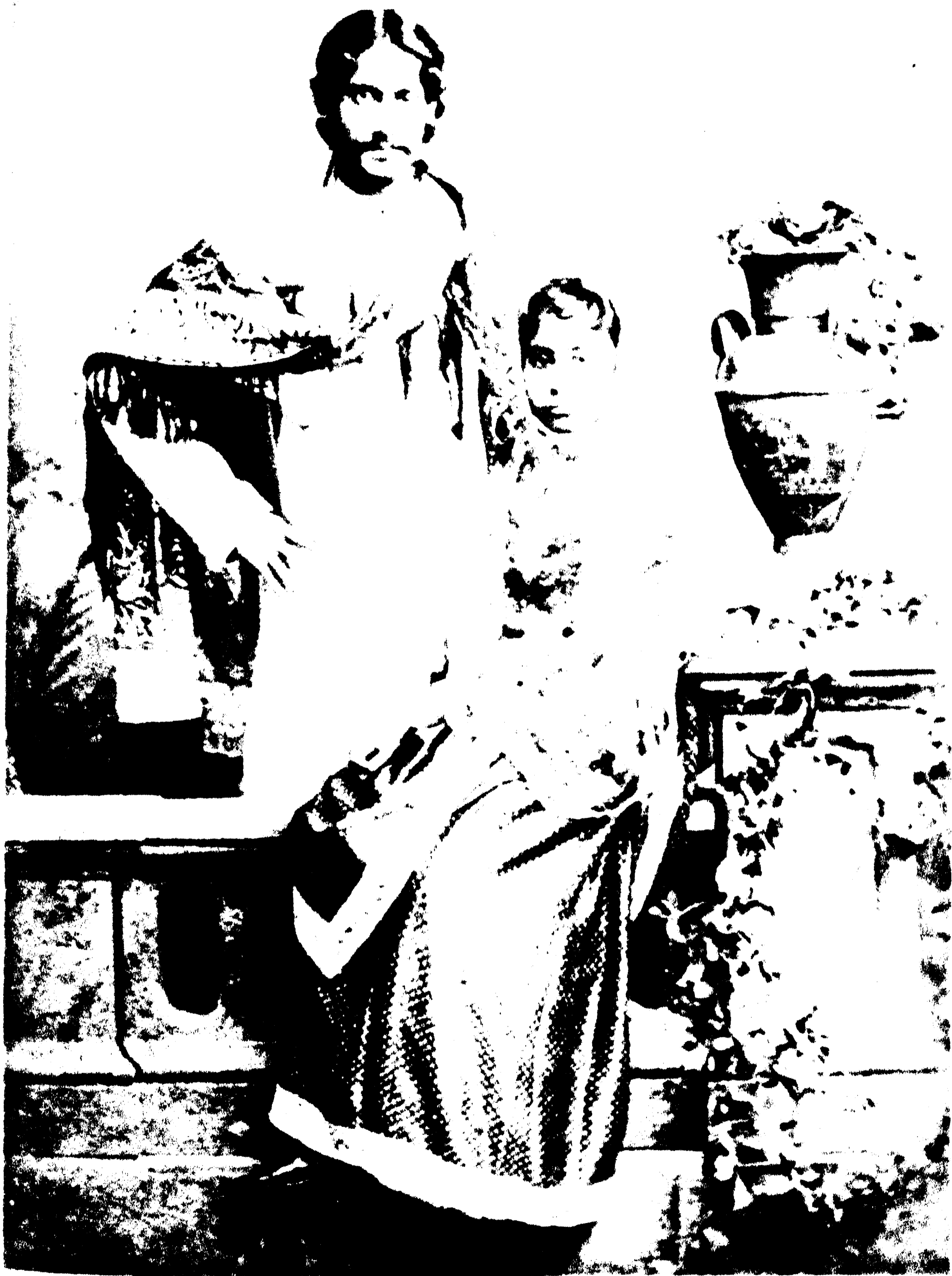
ব্রহ্মনাথ ও তাঁহার সহধর্মিণী