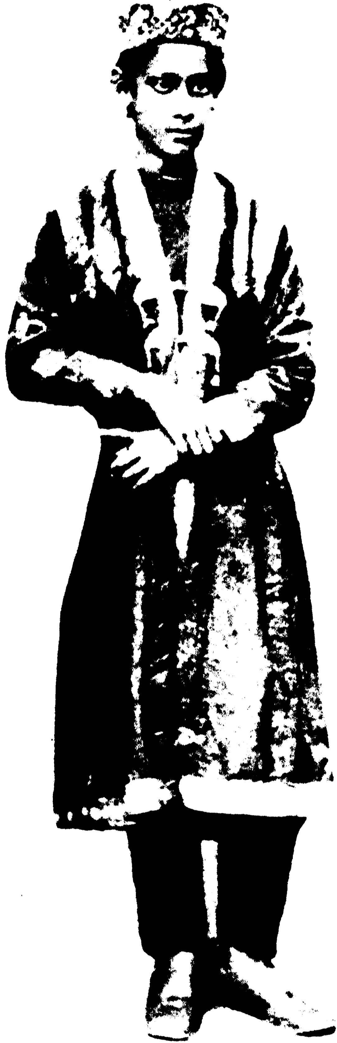
রবীন্দ্রনাথ আনুমানিক বারো বৎসর