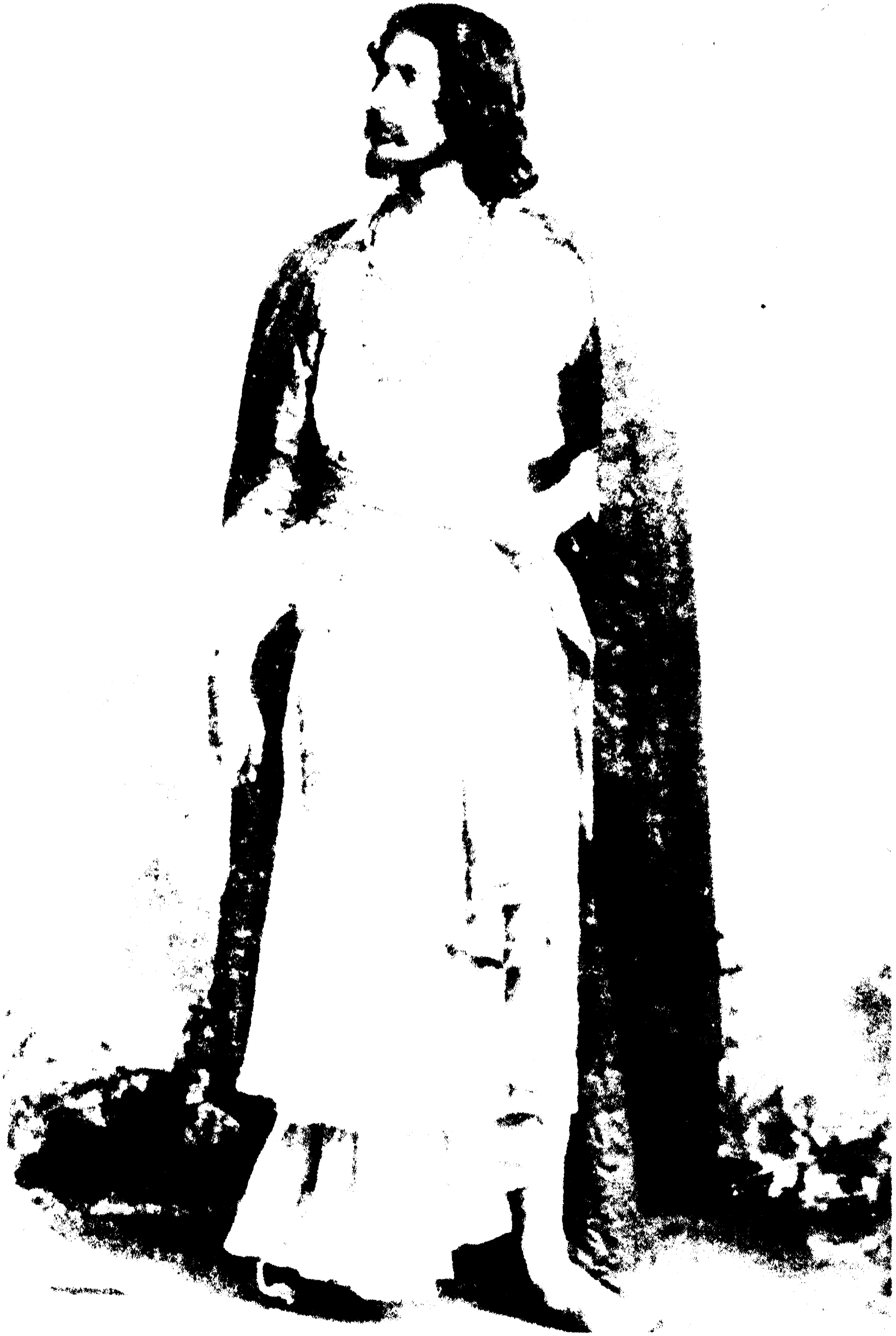
'বাস্মীকি-প্রতিভা' অভিনয়ে বাস্মীকির ভূমিকায় রবীন্দ্রনাথ